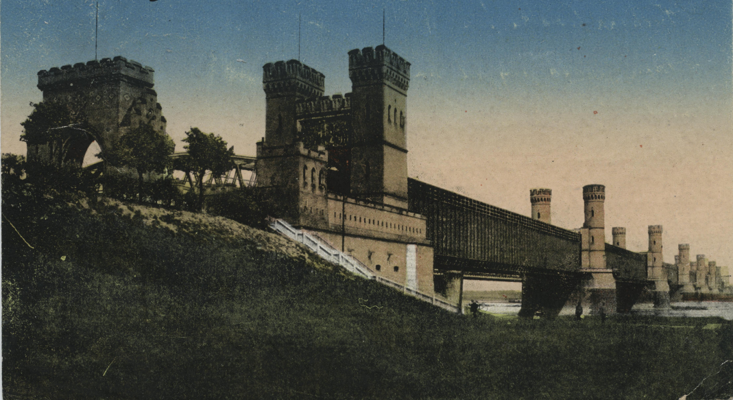
Tczew Dirschau. Brücke über die Weichsel.