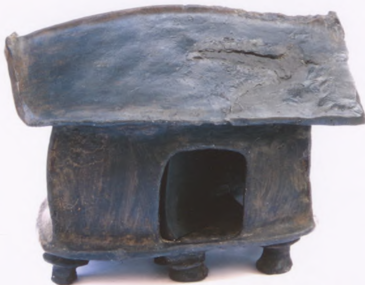
Urna domkowa (kopia), Obliwice (MK/A/24), zbiory Muzeum w Koszalinie

Muzeum Historyczno-Etnograficzne w Chojnicach ul. Podmurna 15, 89-600 Chojnice tel./ fax 052/ 397 43 92 http://www.chojnicemuzeum.pl mail: muzeum@chojnicemuzeum.pl