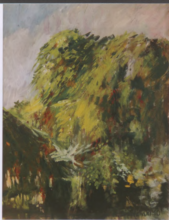
ZYWOPIKOT, olej, płótno

Oprócz projektowania uprawia malarstwo i rysunek. Od wielu lat uczestniczy w plenerach malarskich. Twórczość malarską prezentował na kilku wystawach indywidualnych oraz wystawach zbiorowych, zwłaszcza poplenerowych. Prace głównie w zbiorach prywatnych w kraju i za granicą.