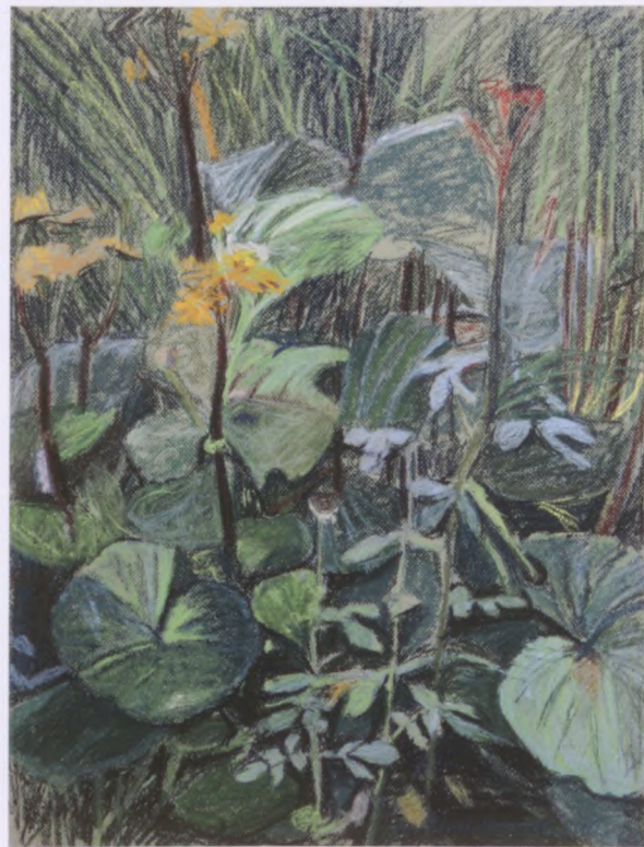
W OGRÓDZIE, pastel