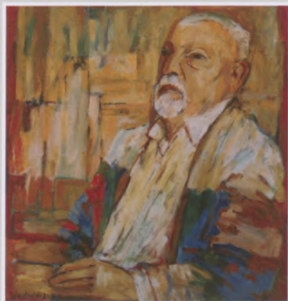
AUTOPORTRET, olej, płótno