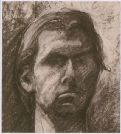
AUTOPORTRET, rysunek węgłem