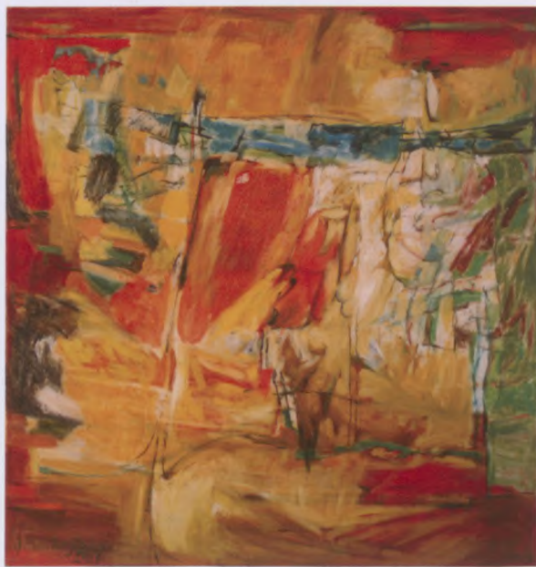
TANCZĄCY ZUBRAN, olej, płótno