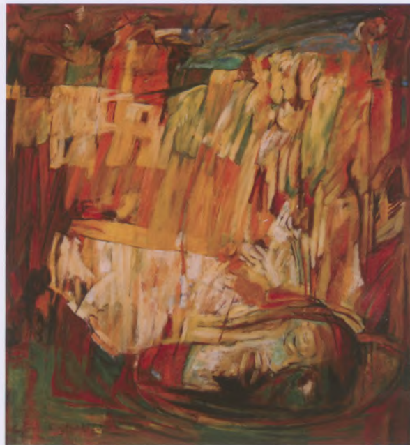
GŁOWA HOLOFRENESA, olej, płótno