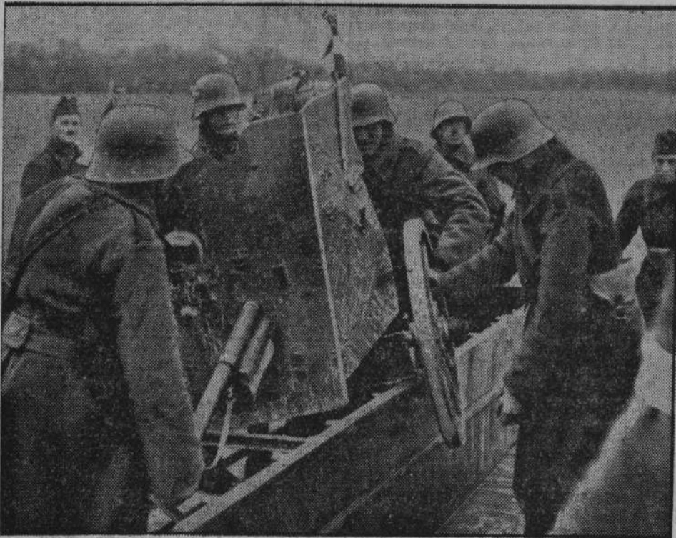
Na zdjęciu przewożenie dział przez Dunaj pod Komarnem.