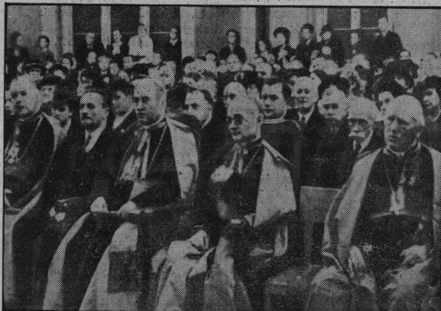
Z inauguracji Instytutu Wyższej Kultury Religijnej