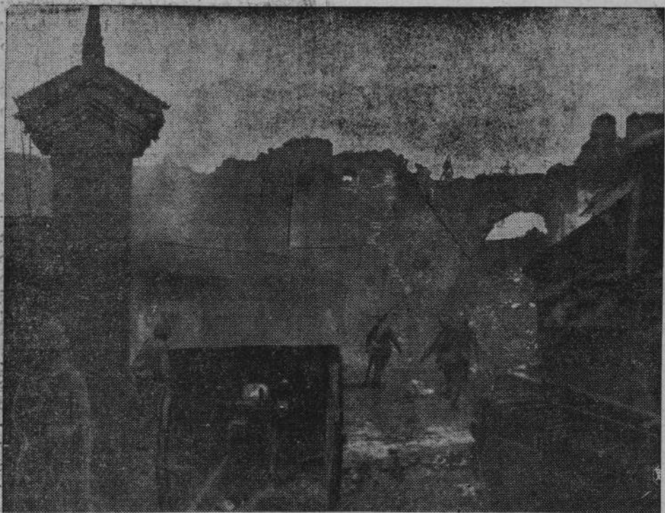
Na zdjęciu — fragment z zajęcia przez wojska japońskie miasta Sinyang w Chinach Środkowych.