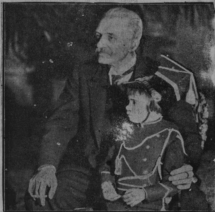
Prezydent Rzplitej Mościcki jest dumny ze swego wnuka — wszak to młodzieńki szwoleżer, który marzy już o laurach...