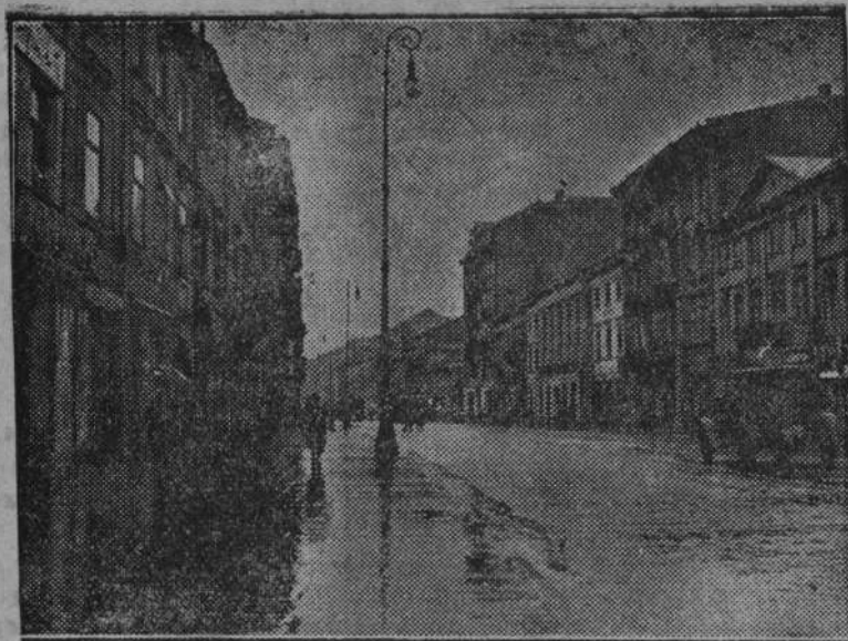
Nowy Świat podczas deszczu.