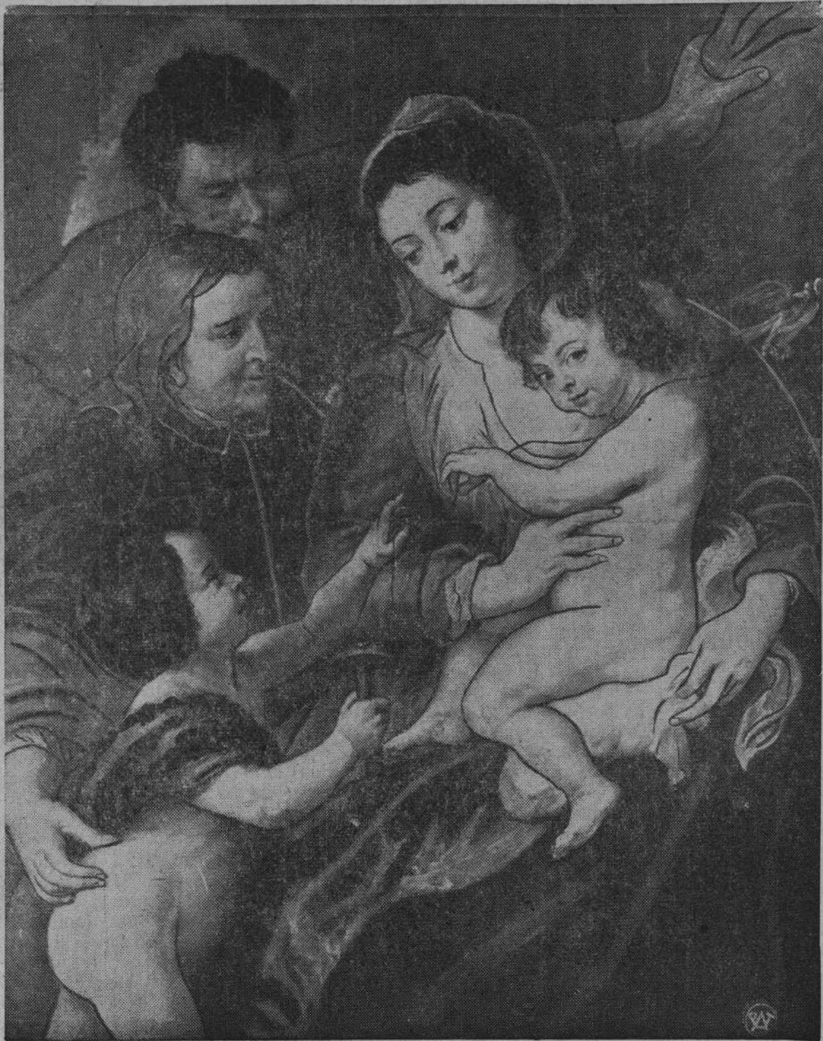
Madonna z Dzieciątkiem Jezus.

I dlatego też święta Bożego Narodzenia połączone są najgłębiej z tradycjami narodu polskiego, związane są też pięknym wieńcem legend polskich i z niezliczonymi utworami naszej