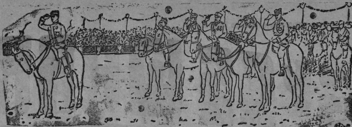
Uroczystość 3-go Maja w stolicy. Podczas Mszy Świętej Minister Spraw Wojskowych generał Wład. Sikorski, za nim od lewej ku prawej generałowie: Osiański, Żeligowski, Haller Stan. i Rozwadowski. Chwila podczas podniesienia.

— W ostatniej chwili donosimy pp. mistrzom wystawiającym okazy na Wystawę Prac Uczni Rzemieślniczych, że wszelkie ofiary winny być najpóźniej we wtorek, dnia 12 bm. na miejscu Wystawy (Fabryka Kapeluszy) złożone.