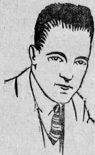
Por. Byrd — lotnik amerykański — wstawił swe imię odkryciem Bieguna Północnego.

Poznań. W więzieniu w Rawiczu wybuchł bunt więźniów. Dozorcy więzienni przy pomocy posterunków bunt zlikwidowali. Śledztwo w toku.