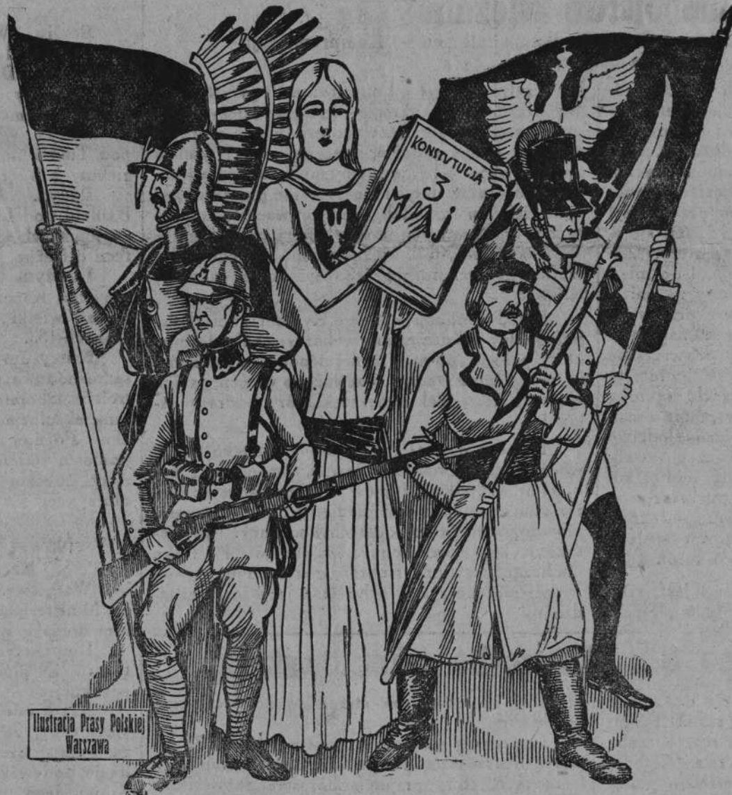
Ilustracja Prasy Polskiej Warszawa

Oto jest najwspanialszy sposób — uczczenia Konstytu- cji i pamięci Jej Twórców. J. K.