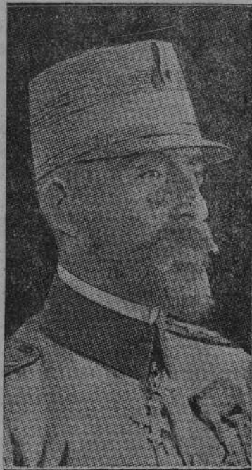
Zmarły król Rumunji Ferdynand z dynastji Hohenzollernów. * 24. VIII. 1865 R † 20. VII. 1927 R.

Dziś o godz. 8-ej zrana, zebrała się rada ministrów w celu omówienia programu uroczystości pogrzebowych.