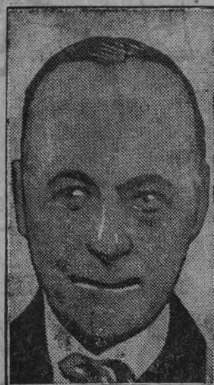
Theunis, b. premier belgijski przew. wszechświatowej konferencji ekonomicznej w Genewie.

Niechaj ten przykład będzie nowym dowodem oszustw cyganów.