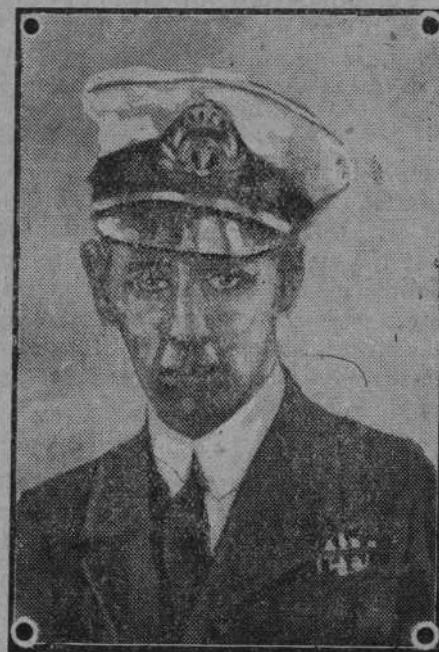
Książę Mikołaj, młodszy syn królewskiej pary rumuńskiej, który był w ostatnich czasach także wysuwany na następcę tronu rumuńskiego.