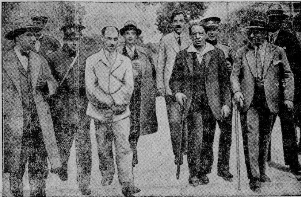
Kilka dni temu zakończył się na Węgrzech proces przeciw cyganom-ludożercom. Obrazek przedstawia głównego herszta, którego prowadzą do więzienia.