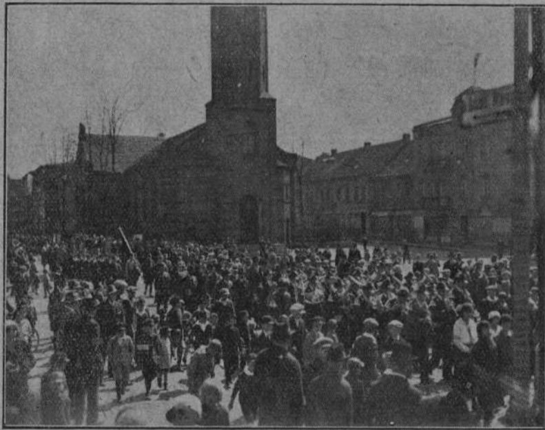
TRZECI MAJA W WĄBRZEŹNIE. Pochód towarzyszy i organizacji na uroczyste nabożeństwo.

— Zawsze zwracam się z gorącym apelem i prośbą do czynników miarodajnych, by zechcieli laskawie wyszukać źródła skutecznej pomocy osadnictwu. Staram się również bardzo, by Okręgowy Urząd Ziemiński przyznając pożyczkę inwestycyjną dla osadników, wystawił skrypta dłużne na całą sumę, t. j. 4.300,— zł., unikając w ten sposób kosztów osadnika, gdyż notarialne uwierzytelnienie podpisów ręczyteli petenta pociąga za sobą niepożądane wydatki, a i Okręgowemu Urzędowi Ziemińskiemu zmniejszy pracę. Nie znaczy to, że osadnik ma dostać od razu 4.300,— zł. do ręki, gdyż uniemożliwiło by to kontrolę nad prawidłowym użytkowaniem tych pieniędzy, lecz mam tu na myśli możność utworzenia konta dla osadnika, by ratalnie mógł pożyczkę wykorzystać. (O).