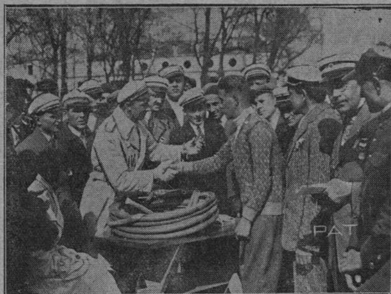
KOLARSKI BIEG NAPRZELAJ.

— W sprawie zasiłku dla rodzin rezerwistów powołanych na ćwiczenia wojskowe. Ministerstwo Spraw Wewn. pismem okólnym z 5. III. 1931 r. poleciło wojewodom nadesłanie w terminie do 25 marca rb. sprawozdania o przebiegu akcji wypłacania zasiłku za ćwiczenia wojskowe rezerwistów, a w szczególności o doniesienie Ministerstwu, czy i w danym razie z jakich przyczyn wypłat zasiłku nie uskuteczono dotychczas. Zarazem Ministerstwo poleciło wydanie zarządzenia, aby przy sposobności wręczania kart powołania na ćwiczenia wojskowe urzędy gminne informowały zainteresowanych, gdzie należy wnosić podania o wpłatę zasiłku i że wnoszenie podań do władz centralnych jest niewłaściwe. Fakt nadsyłania podań do Ministerstwa świadczy o tem, że ludność nie jest poinformowana należyście o trybie wnoszenia i rozpatrywania podań w powyższym przedmiocie.