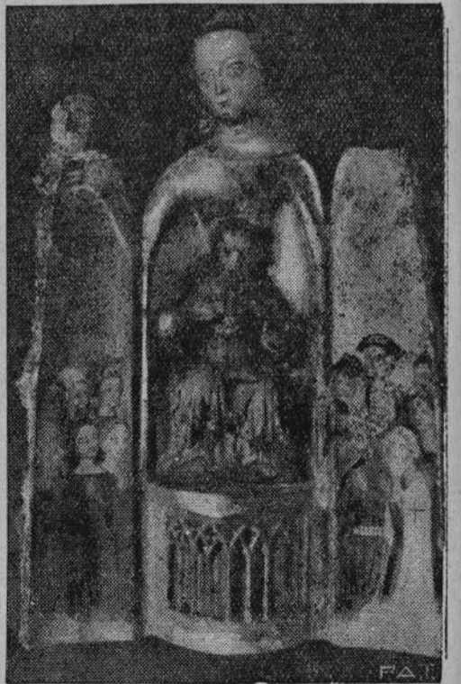
Na zdjęciu naszym podajemy wizerunek odkrytej rzeźby. Odkrytej w Starogardzie.

W ten sam sposób jak wyżej wspomniano zauważyć można, czy praca cylindra jest beznaganna. Jeżeli cylinder jest już wyrobiony, część pracy wychodzi rurą wydechową bez wykonania przez znaczonej dla niej pracy. Gdy chodzi przy cylindrze lub tłoku tylko o bardzo małe zużycie (10 mm) uniknąć można stratę pary przez rozłożenie lub odnowienie pierścieni tłokowych. Przy większym zużyciu poleca się jednak szlifowanie cylindra. Im rychlej praca ta zostanie wykonana, tem mniejszy jest stopień zniszczenia materiału i tym dłużej cylinder można używać. Mylnem jest zdanie, że przez przedwczesne szlifowanie cylindra tenże prędzej ulega niszczeniu niż przez pracowanie nadal w poprzednim stanie. Tak samo jest mylnem, unikanie kosztów szlifowania cylindra bowiem przez wspomnianą stratę pary