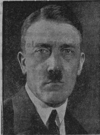
ADOLF HITLER Kanclerz Rzeszy Niemieckiej

Za 10 lat nie będzie już w Niemczech marksizmu. W dążeniu do osiągnięcia swoich celów, Hitler gotów jest narazić się na największą niepopularność i nie ustąpi, choćby go nawet naród miał ukamienować.