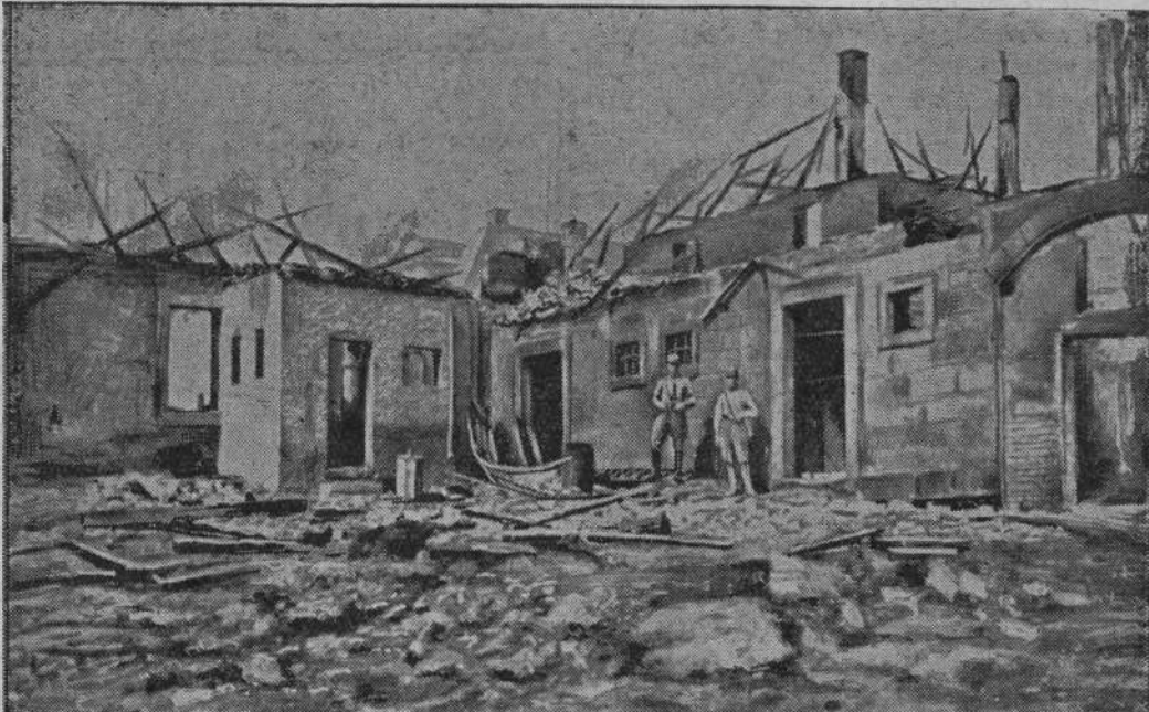
Miejscowość Teuschnitz w Frankonii (Frankenwald) nawiedziła katastrofa pożarowa. Spłonęło 14 domów mieszkalnych i 17 innych zabudowań. —