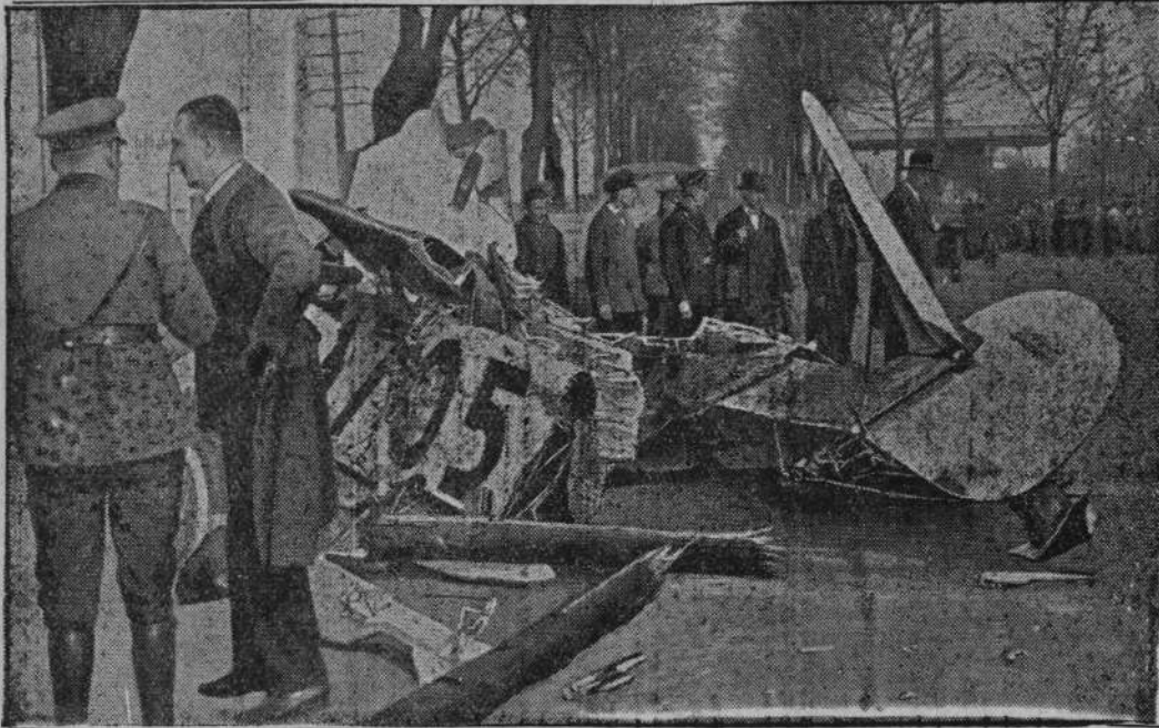
W Staaken pod Berlinem zaszedł podczas imprezy lotniczej wypadek, który spowodował śmierć 3 osób. Samolot runął na ulicę zabijając 2 przechodniów. Pilot poniósł również śmierć.