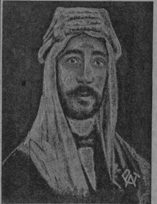
Król Iraku Fajsel zmarł w Brnie dn. 7 bm.

Dotyychczasowy władca Iraku Król Feisal zmarł nagle w Brnie szwajcarskim na udar sercowy. Czy następcą jego 20-letni Gazhi zdoła opanować wzburzoną sytuację wewnętrzną? Czy okaże się dość silny, by przeciwstawić się rosnącej z każdym dniem w siłę partii wolnościowej, która dąży do całkowitego uniezależnienia Iraku od Anglii.