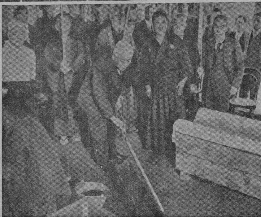
Japoński prezydent ministrów Makoto Saito odwiedził ostatnio największą fabrykę broni, żywo interesując się jej urządzeniami. Jako symboliczny akt, bardzo zresztą rozpowszechniony na Dalekim Wschodzie, odebrał on z rąk robotnika rozpalony do białości miecz i sam go hartował.