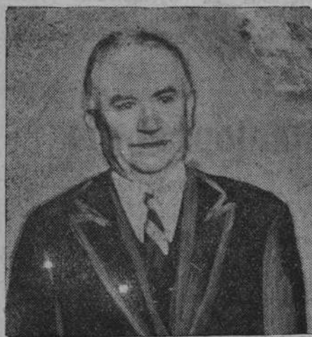
B. prezydent Republiki Gaston Doumergue obecny premier Francji.

PARYŻ. W dniu 9 bm. nastąpiło ostateczne ukonstytuowanie rządu, którego skład jest następujący: