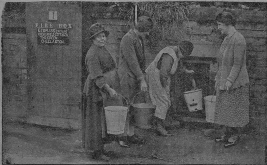
Długotrwała susza w Anglii spowodowała katastrofalny brak wody. Ludzie muszą chodzić daleko po wodę.