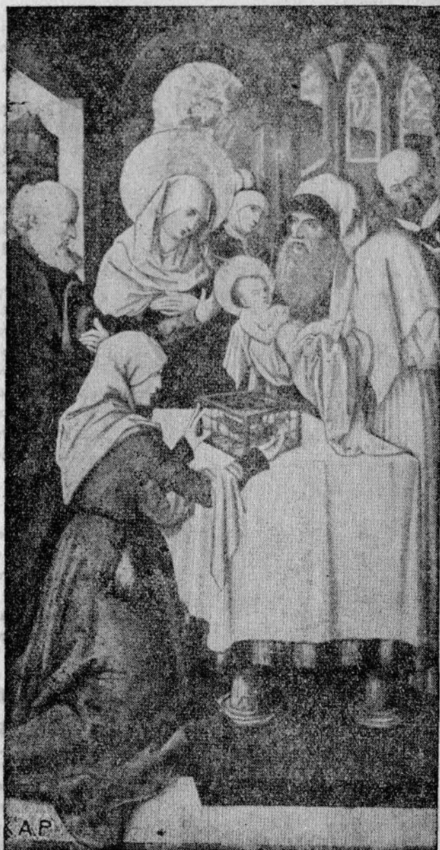
Ofiarowanie Dzieciątka Jezus w świątyni jerozolimskiej

Kościół katolicki obchodzi w tym dniu pamiątkę obrzezania Zbawiciela ósmego dnia po narodzeniu. Obrządek ten był przez żydowskie prawo liturgiczne ściśle przestrzegany. Podobnie jak przez chrzest staje się katolickim członkiem Kościoła, tak stawał się żyd-