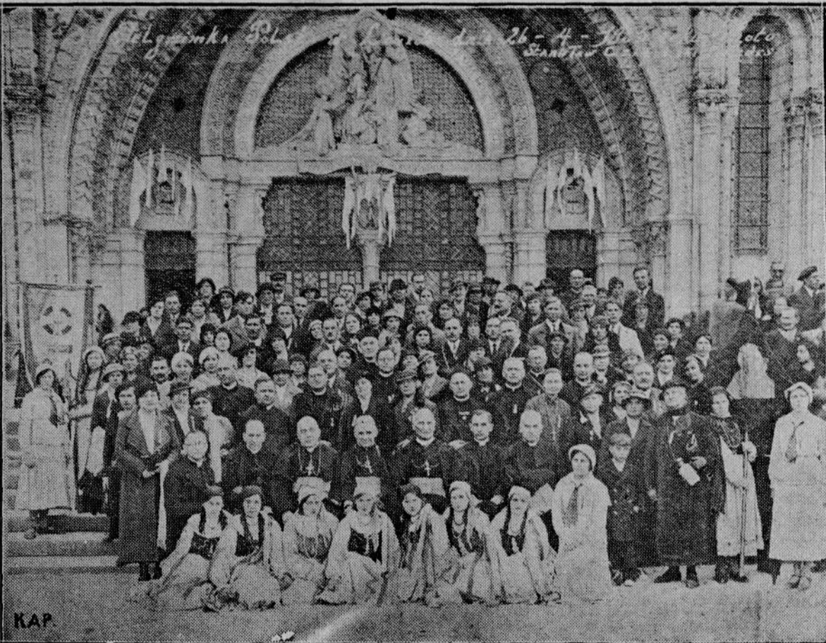
Pielgrzymka polska w Lourdes na uroczystości zamknięcia Jubileuszowego Roku Okupienia.

Staszic, Mickiewicz, Słowacki, Fredro, Korzeniowski, Kraszewski, Asnyk, Ujejski, Sienkiewicz, Prus, Orzeszkowa, Żarowski, Reymond,