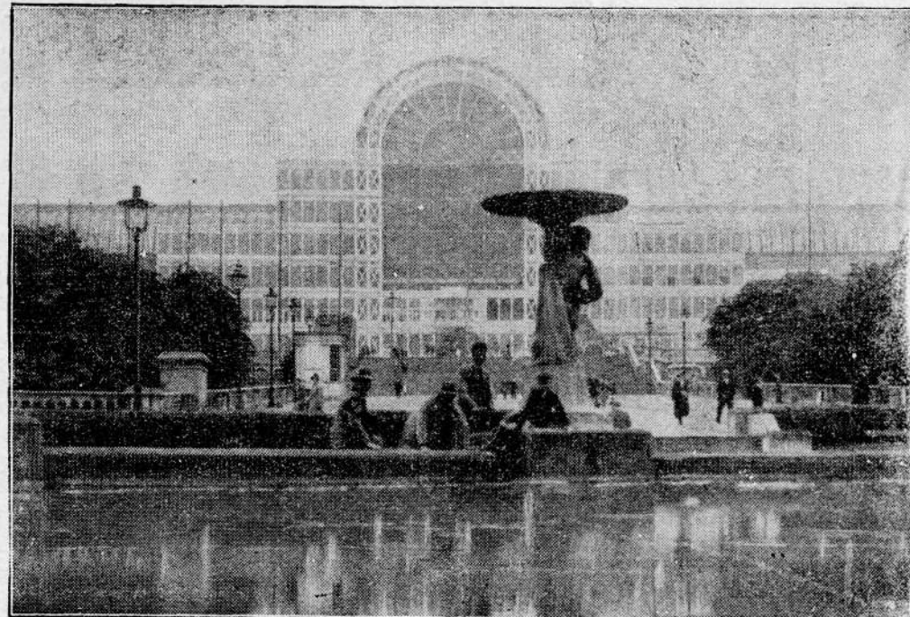
Pałac Kryształowy przed pożarem

siłków straży ogniowej, na cały budynek. 65 motorowych sikawek pracowało bez przerwy. Płomienie dosięgły w końcu dwóch wież, z których jedna strawiona ogniem runęła z ogłuszającym hukiem. Upadła drugiej groził zatarasowaniem toru kolejowego