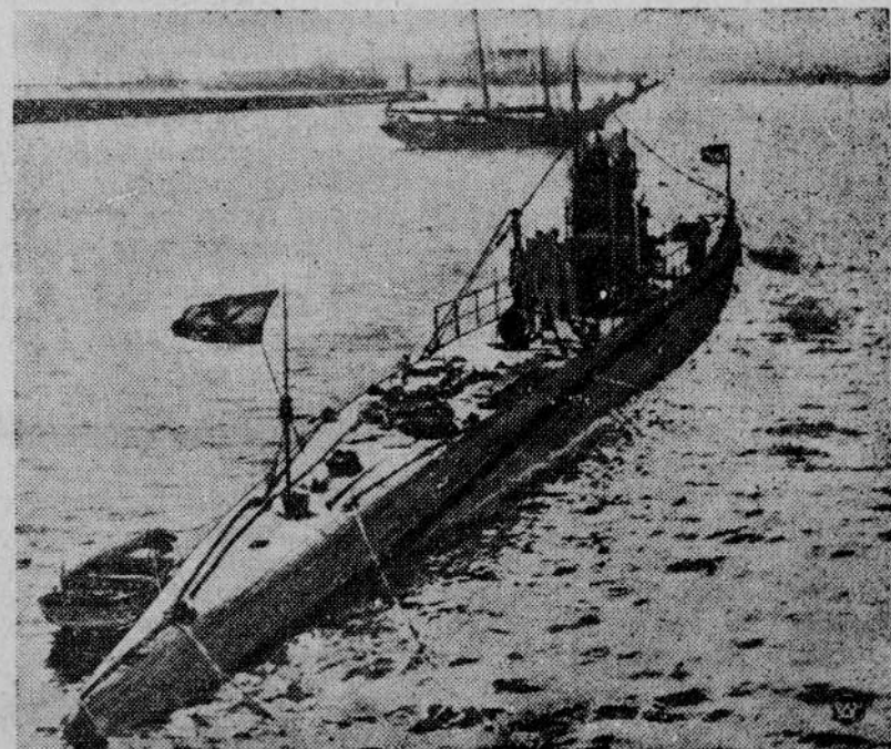
Hiszpańska rządowa łódź podwodna „C 2” którą powstańcy chcieli zawładnąć w Breście

LONDYN. Jak donoszą z Tokio, toczy się tam od pewnego czasu ożywiona kampania na rzecz zacieśnienia sojuszu Japońsko-Niemieckiego. Rocznicą podpisania układu Japońsko-Niemieckiego ma być w całym kraju uroczyste obchodzone.