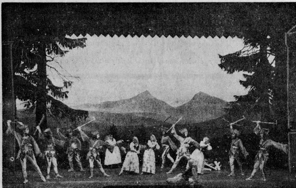
Sukces „Harnasiów” w Hamburgu.