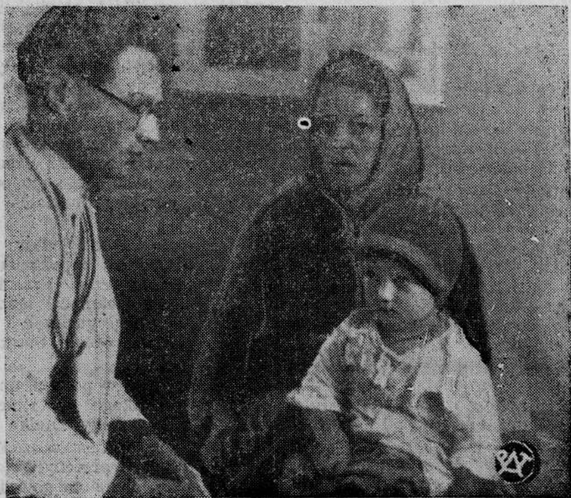
Pierwsza w Polsce Wiejska Spółdzielnia Zdrowia.

TARNOPOLE. Policja Państwowa w Czortkowie miała do rozwiązania nielada zagadkę. Właściciel dóbr w Białej pod Czortkowem, p. Horodynska otrzymała anonim, podpisany przez „Związek Bandytów w Polsce”, w którym nieznanemu człowiek tego związku żądał natychmiastowego okupu w wysokości 2.000 zł, grożąc podwyższeniem wysokości okupu do 20.000 zł. Policja Państwowa po obserwacji aresztowała niejakiego Pawła Kliszczaka, jako podejrzanego o podpisanie tych gróźb.