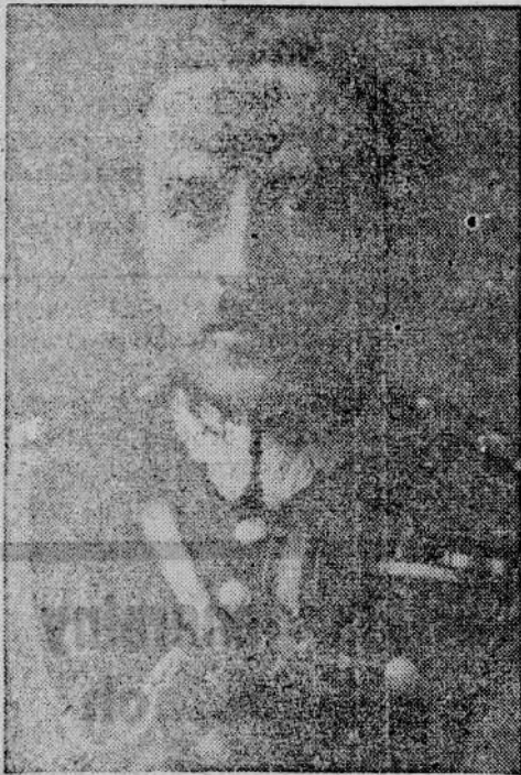
Szef O. Z. N. gen. Stan. Skwarczyński

Od roku 1935 zmieniło się wiele na świecie i w Polsce.