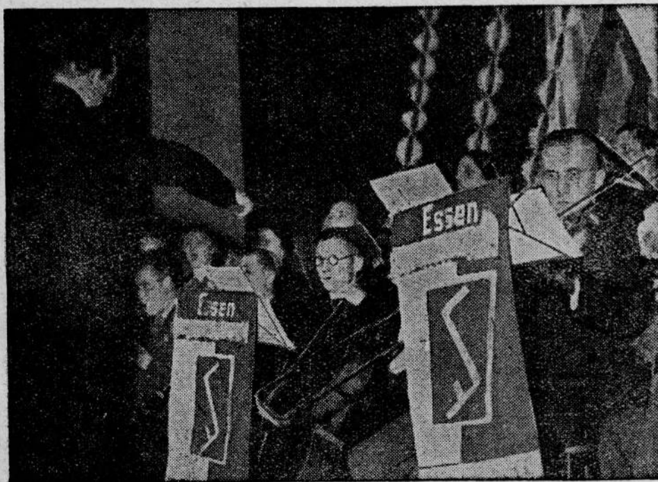
Śpiewacy Rodła i orkiestra polska z We stfalii

Niemcy w Kłajpedzie domagają się pełnej autonomii.