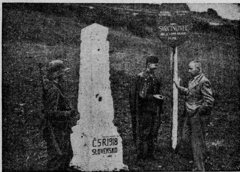
Stup graniczny czeski z 1918 roku z okresu przed zajęciem przez Czechów Śląska Zaolziańskiego. Dziś stupa ten stanowi znowu granicę czeską.