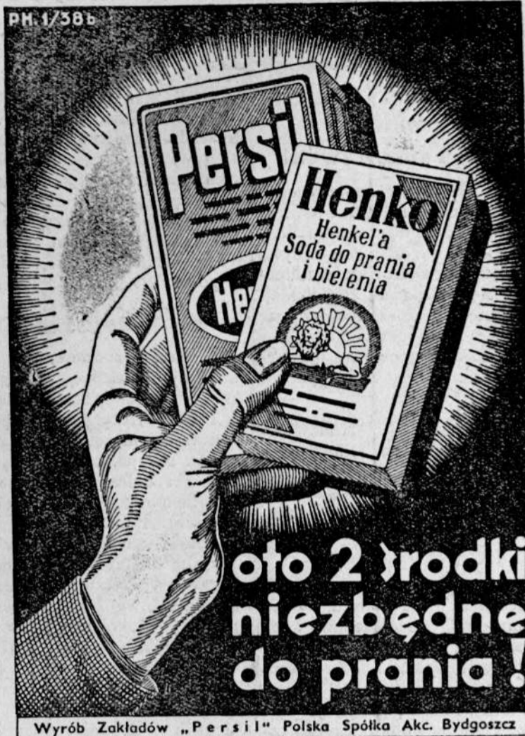
Wyrób Zakładów „Persil” Polska Spółka Akc. Bydgoszcz

sie na 15 lat więzienia za zabójstwo posła sowieckiego w Polsce Wojkowa i opuścił więzienia w Grudniadzu dopiero niedawno. Po opuszczeniu więzienia złożył on egzamin maturalny.