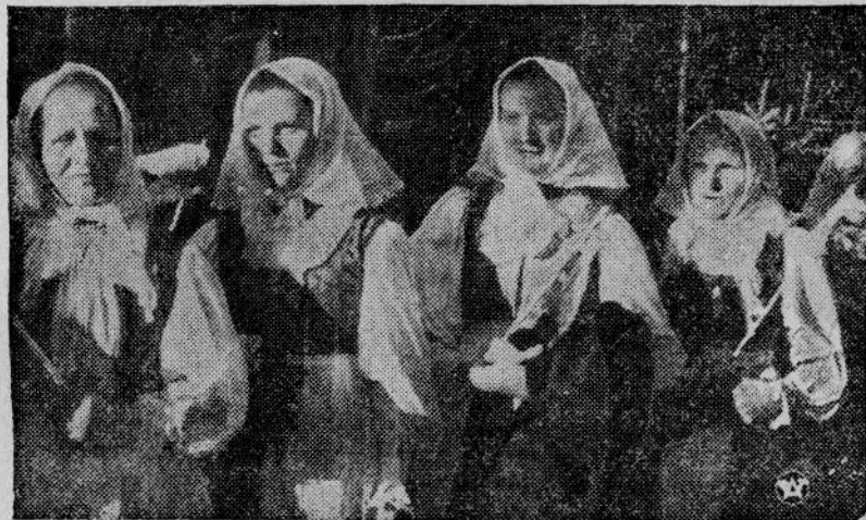
Rodaczki z Jaworzyny.

Zwraca się uwagę, że wyborca przychodzący do lokalu wyborczego powinien mieć kartkę głosowania przygotowaną.