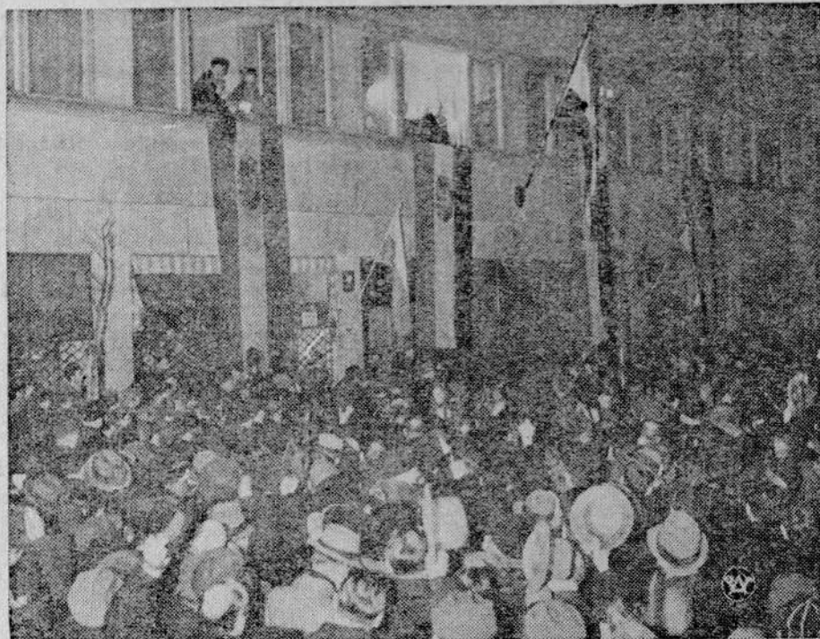
Manifestacje Warszawy po odzyskaniu wspólnej granicy polsko - węgierskiej.

Dotychczasowy stan rzeczy pod wzgl. plomb, używanych przez młyny, budził poważne zastrzeżenia z uwagi na to, że przepisywe plomby nie odpowiadały swemu celowi pod względem dostatecznej precyzji zamknięcia i niemożności otwierania ich. Powodowało to szereg nie zawinionych przez młyny dochodzeń i kar porządkowych. Jak się dowiadujemy się z miarodajnego źródła, nowy typ plomb, opracowany przez Ministerstwo Skarbu w porozumieniu z zainteresowanymi wytwórcami, usuwa dotychczasowe braki i zapewnia dokładne zamykanie plomb, usuwając możliwości ich otwierania bez naruszenia etykiety, na którą została plomba założona. Zmiana ta zostanie niezawodnie powitana przez młynarstwo z zadowoleniem.