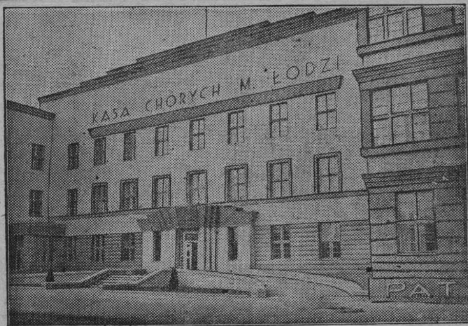
Nowy gmach Kasy Chorych w Łodzi. Został otwarty w dniu 5 listopada br.