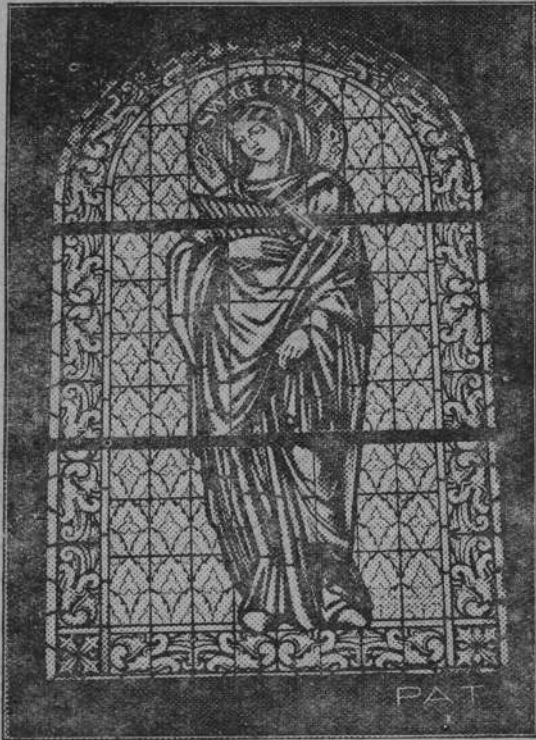
Piękny witraż w starym kościele pobarocowym