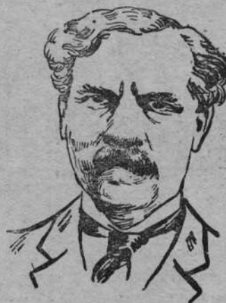
Mac Donald premjer rządu koalicyjnego.