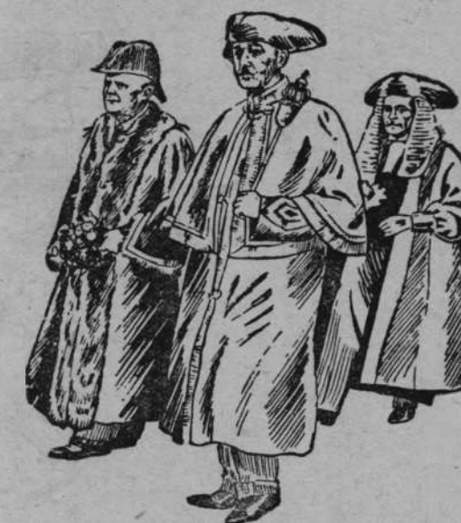
Pomimo ciężkiego kryzysu wybór Lorda-Mera Londynu odbył się tradycyjną wspaniałością. Na rycinie Lord-Prezydent Londynu Sir Maurice Jenks (z bukietem w ręku) przechodzący w asyście przez ulice Londynu.