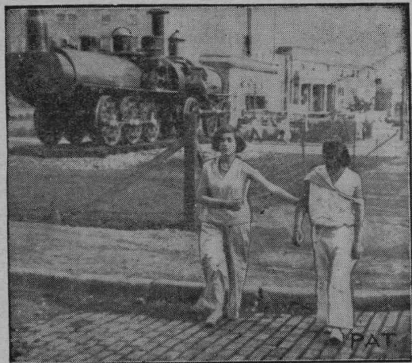
OBRAZEK Z KANADY.

Oto najnowszy model płaszcza popołudniowego „Bagdad“ z Crepe-Cambodge na podszewce z Crepe-Satin, z wspaniałym przybraniem z czarnych lisów.