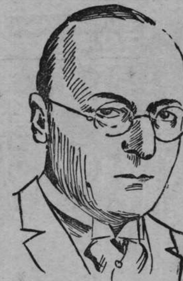
Kancelarz Rzeszy Dr. Brüning.