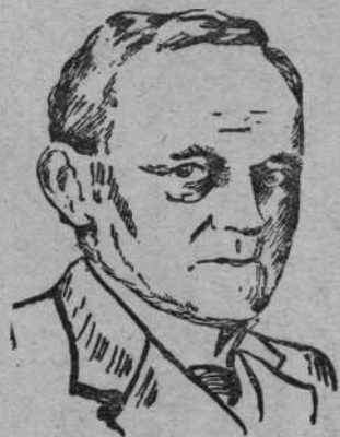
Snowden, kanclerz skarbu.

Czankajczek, prezydent rządu chińskiego oświadczył na zebraniu politycznym w Nankinie, że, o ile nie uda się Lidze Narodów utrzymać spokój na dalekim Wschodzie, Chiny są zdecydowane do prowadzenia wojny aby bronić swego świętego prawa i uszanowania międzynarodowych umów (paktów) bez względu na to, że kraj zostałby na pół wieku finansowo zrujnowany.