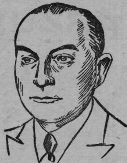
Dr. Curtius minister Spraw Zagranicznych.