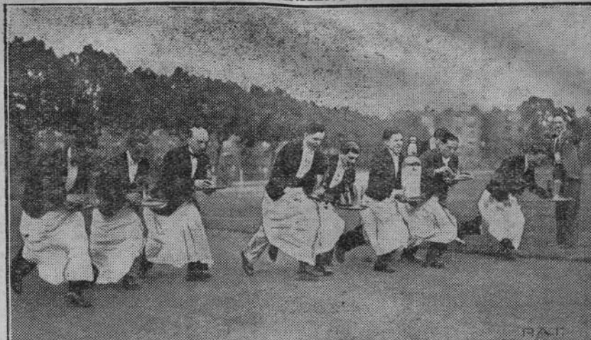
Na zdjęciu naszym widzimy drużynę jednego z wielkich hoteli londyńskich, trenującą do wesolych mistrzostw kelnerów.