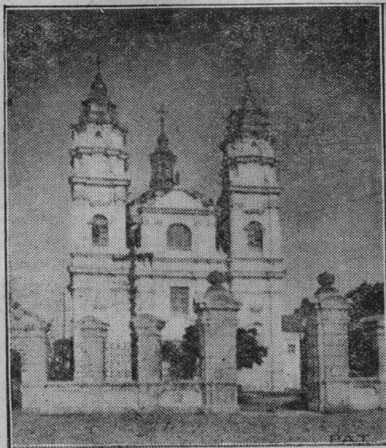
Na zdjęciu naszym widzimy fronton kościoła parafjalnego we Włodawie w powiecie włodawskim. Jest to jeden ze starszych zabytków budownictwa kościelnego na ziemiach Polski.