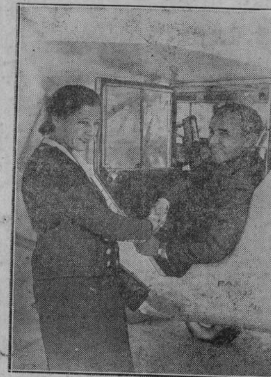
Sławny lotnik angielski J. A. Mollinson ze swą żoną lotniczką Amy Johnson