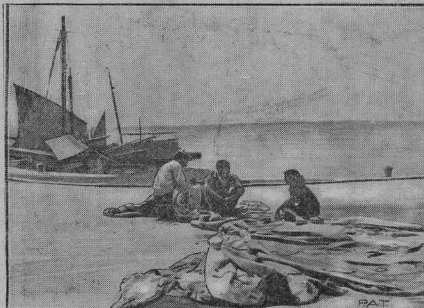
Jugosławia posiada niezliczone zaciszne plaże morskie, na których spędzają lato mieszkańcy wielkich miast odpoczywając po zgiełku miejskim. Na fotografii naszej widzimy letników na plaży w Omis w rozmowie z powracającym z połowu rybakim.