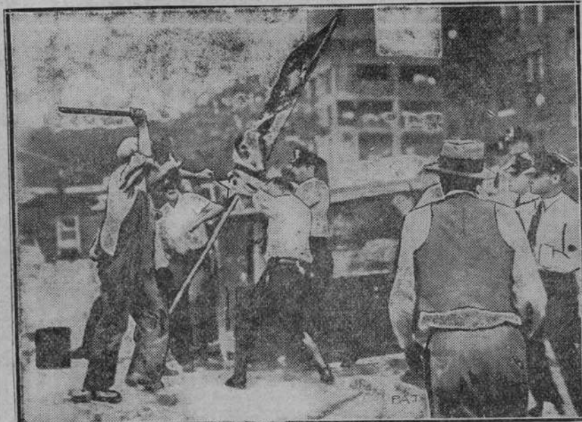
Oto dramatyczny moment przymusowej ewakuacji obozu weteranów amerykańskich w Waszyngtonie. Policja zdobywa sztandar b. żołnierzy, którzy rozpaczliwie go bronią. Podczas tych zamieszek zabity został jeden weteran a wielu jest rannych.