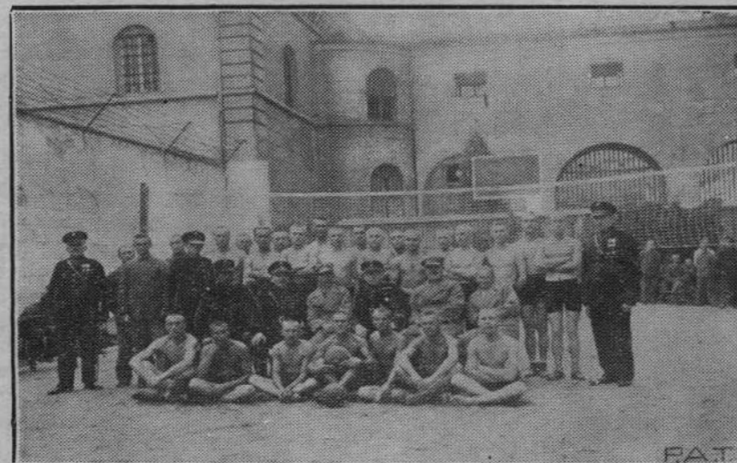
Władze więzienne w więzieniu w Kaliszu zaprowadziły od dłuższego czasu więzienne drużyny sportowe, które znakomicie się rozwijają.