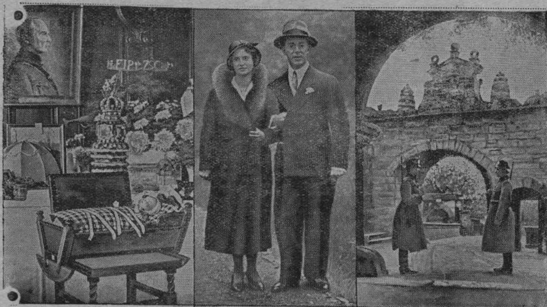
Onegdaj odbył się w Coburgu ślub księżniczki Coburskiej z synem następcy tronu szwedzkiego Gustawem Adolfem. Na obrazku naszym widzimy po prawej stronie część podarków ślubnych, w środku parę młodą, po lewej stronie straż honorową przed pałacem.