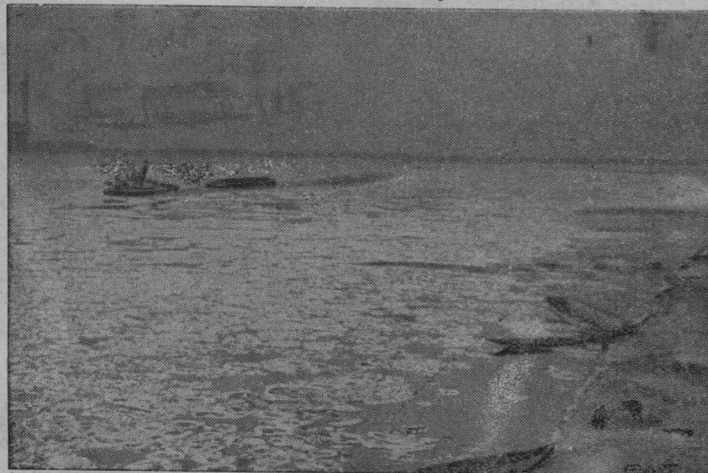
Na zdjęciu naszym widzimy piękny, ale zarazem groźny widok na Wisłę w pobliżu mostu Kierbedzia, pokrytą na całej szerokości gęstą krą. Wśród kry przebija się z trudem holownik, ciągnący za sobą berlinki.