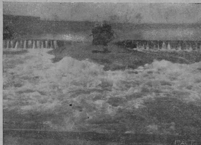
Na sanie pod Przemyślem wybudowali saperzy 4 basen saperów w Przemyślu wielki jaz, który jest pierwszą tego rodzaju budowlą w Polsce. Uroczyste poświęcenie jazu odbyło się w obecności przedstawicieli Ministerstwa Spraw Wojskowych i miejscowych władz dnia 15. ubm.