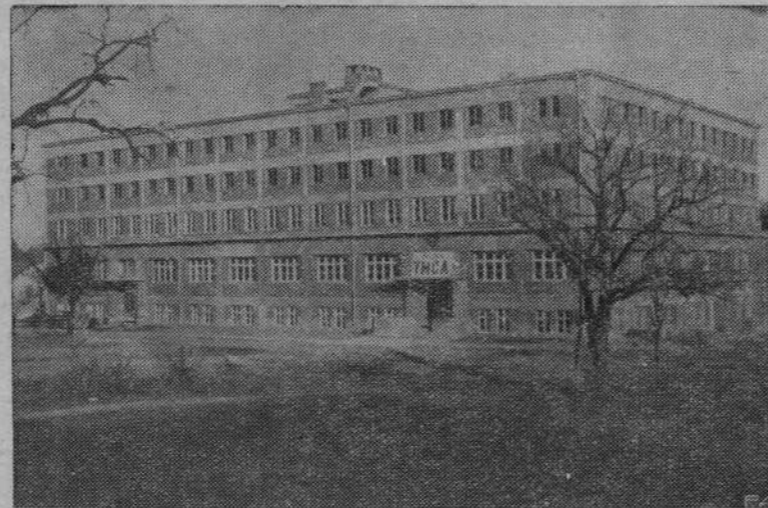
W dniu onegdajszym został częściowo uruchomiony i oddany do użytku nowy obrzydliwy gmach wybudowany przez polską Y. M. C. A., przy ul. Marji Konopnickiej. Gmach ten wyposażony jest we wszystkie nowoczesne urządzenia do najrozmaitszych gier sportowych.