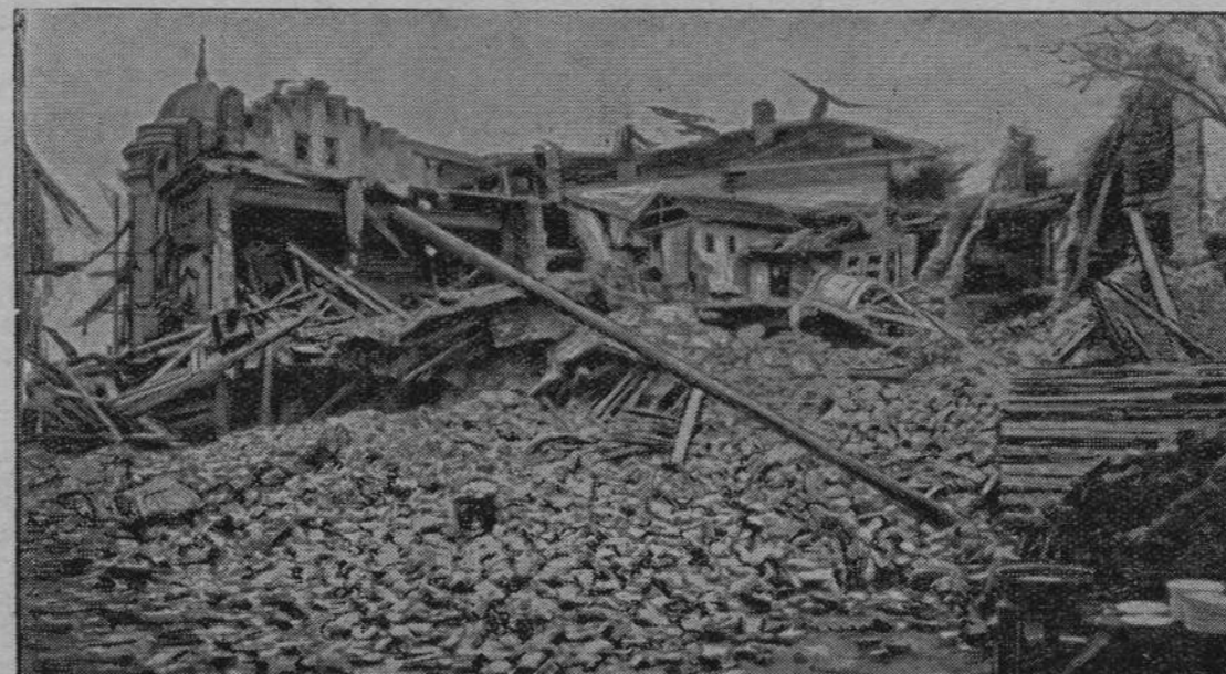
Podajemy dziś jeden z najpierwszych obrazków z trzęsienia ziemi w Grecji, które pociągnęło za sobą śmierć 200 osób. Na obrazku naszym widzimy zniszczenia w okolicy Saloniki.