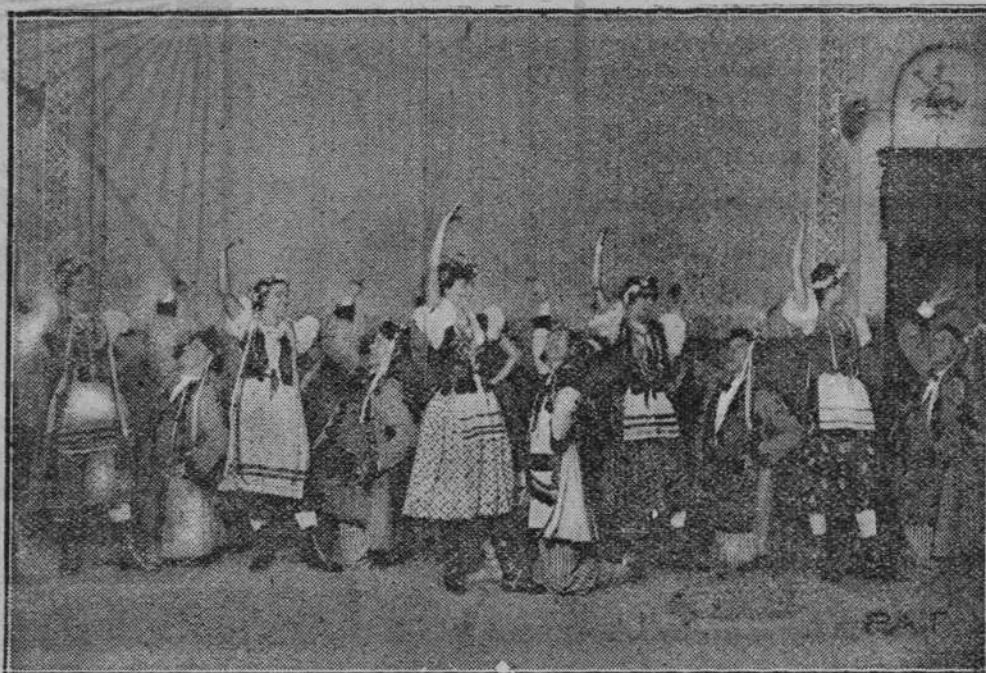
Na zdjęciu naszym widzimy scenę z obchodu narodowego w kolonji polskiej w Porto Allegre (Brazylja). Grupa amatorów odtańczyła na scenie miejscowego teatru San Pedro tradycyjnego polskiego mazura.