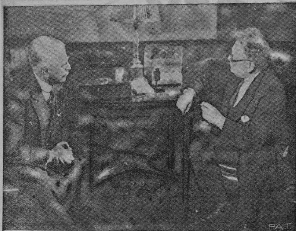
W tygodniu przedświątecznym opuścił Moskwę po kilkuletnim pobycie minister pełnomocny i poseł nadzwyczajny R. P. p. Patek. Przed odjazdem z Moskwy minister Patek złożył oficjalną wzytę komisarzom ludowemu do spraw zagranicznych Z. S. R. R. Litwinowi. Na zdjęciu naszym widzimy p. min. Patka w czasie rozmowy pożegnalnej z p. komisarzem Litwinowem.