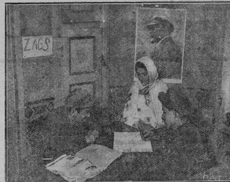
Na zdjęciu naszym widzimy moment zaślubin sowieckich. Za stołem siedzi urzędnik, przed nim nowożeńiec z narzeczoną podpisują akt ślubny, któremu patronuje Lenin z portretu wiszącego na ścianie.