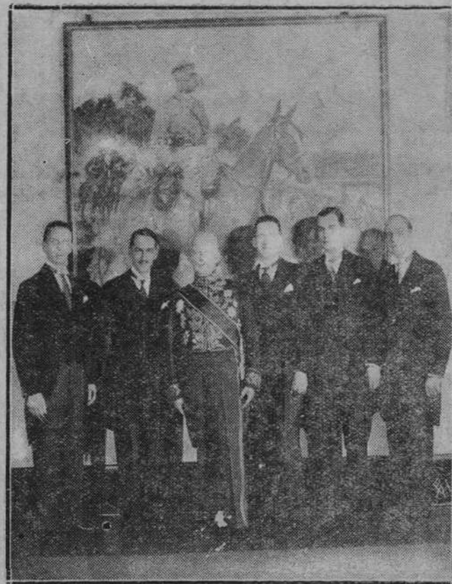
MINISTER PEŁNOMOCNY R. P. W WASZYNGTONIE

W walce przeciw Chińczykom uzyskali Japończycy sprzymierzeńców w szczepach mongolskich które stawily do dyspozycji jeźdźców na wielbłądach.