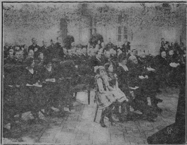
W Warszawie odbyła się akademja ku czci bohaterskich walk o wolność i niepodległość P. O. W.