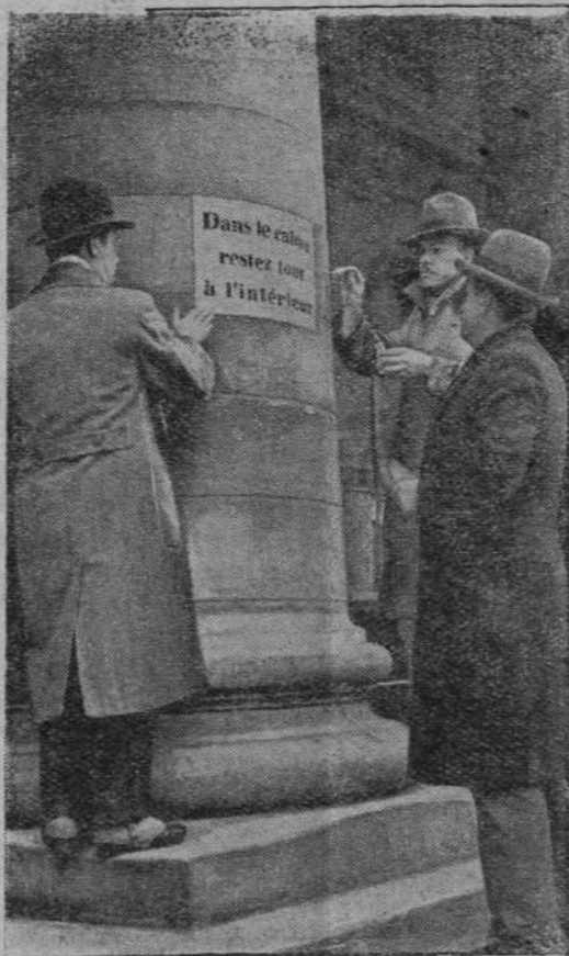
Na obrazku widzimy strajkujących pracowników giełdy nalepiających plakaty nawołujące do strajku.