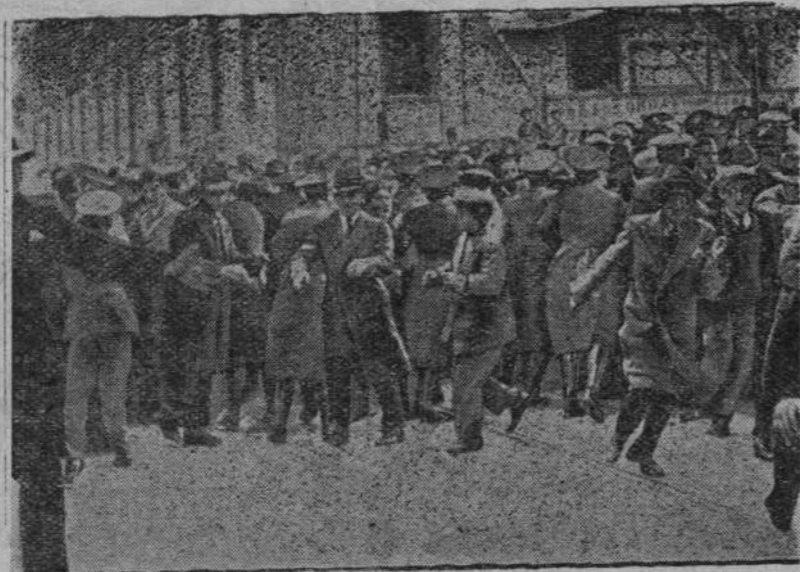
W Grecji po wyborach do parlamentu, które nie wypadły „po myśli opinii publicznej”, przyszło do gwałtownych rozruchów ulicznych. Zrewoltowane tłumy przeciągały ulicami, wo- lając: „Oddamy życie za ojczyznę!” — Tymczasem policja w kilku domach zaciągnęła na górnych piętrach hydranty i poczęła z góry strumieniami wody rozpraszać tłum.