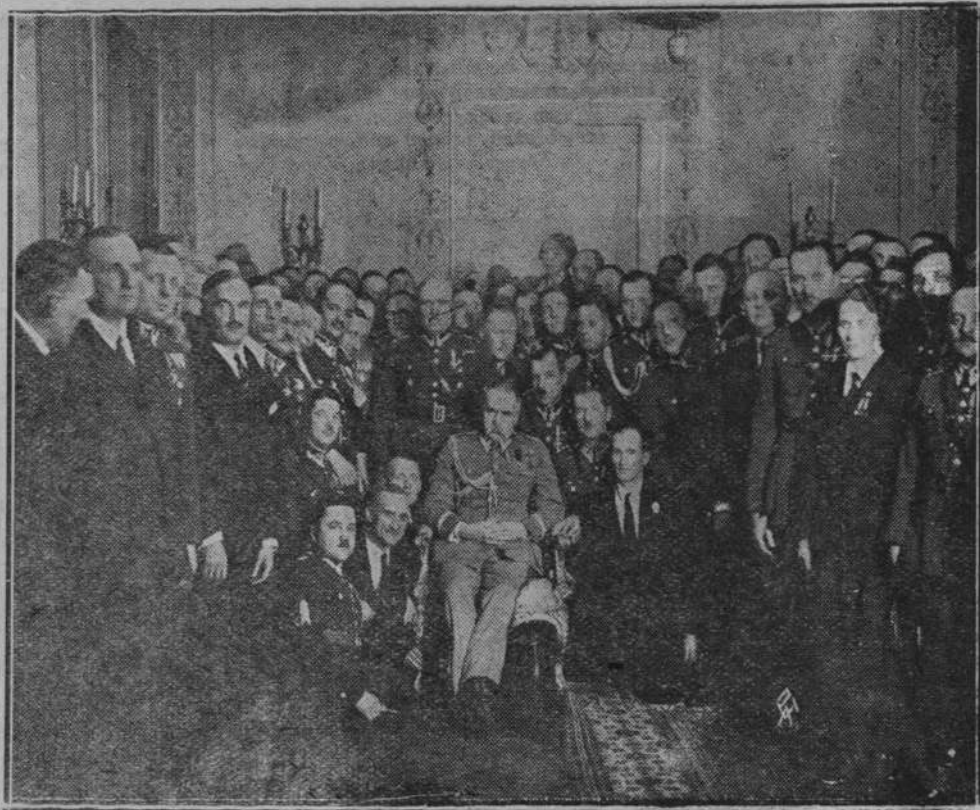
Zdjęcie przedstawia otoczonego Marszałka wśród Peowiaków i żołnierzy II-giej brygady w Belwederze