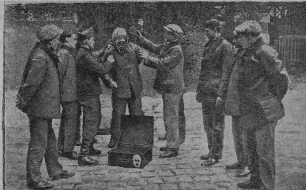
Ćwiczenie przeciwpożarowe, które nawiazano w ostatnim czasie żegluga francuską spowodowało ministerstwo marynarki do wydawania zarządzenia, że na każdym statku znajdować się musi większy oddział wyćwiczonych strażaków. W tym celu otrzymuje pewna część załogi naukę w zwalczaniu pożarów. Na obrazku naszym widzimy oddział marynarki z okrętu „Isle de France” ćwiczących w maskach przeciw dymowi.