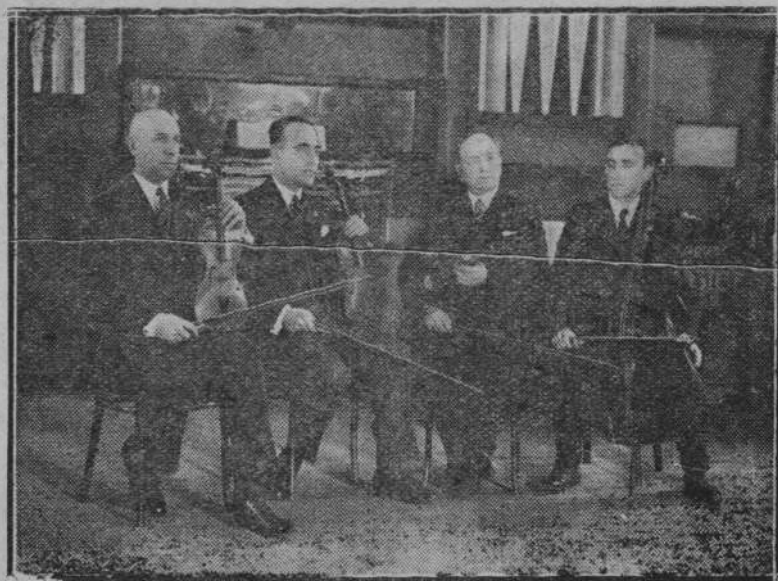
Zdjęcie przedstawia nagrodzony kwartet Lwowskiego Towarzystwa Muzycznego na konkursie smyczkowym w Warszawie