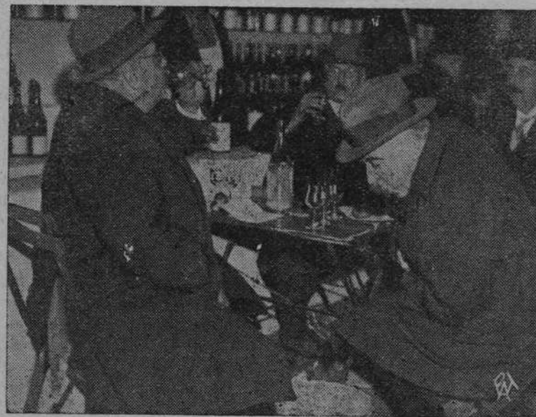
W tych dniach rozpoczęły się doroczne targi win szampańskich w Epernay. Zdjęcie przedstawia jury rzeczoznawców, delektujących się najlepszymi gatunkami wina.