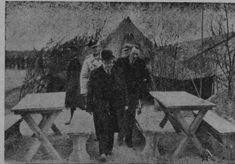
P. Minister Opieki Społecznej dr. Hubicki asystował przy wymarszu pierwszych trzech drużyn „junaków” do ośrodków pracy w Dziekanowie, na Siekierkach i w Górze Kalwarji. Na zdjęciu p. Minister zwiedza obóz w Dziekanowie.