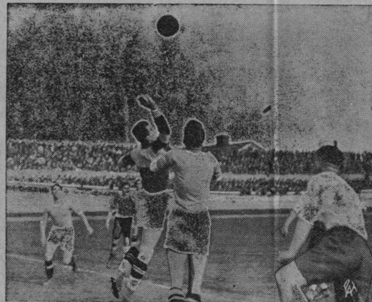
Na zdjęciu naszym podajemy fragment z interesującego meczu piłkarskiego między reprezentacyjną drużyną polską, która miała grać w Pradze z Czechosłowacją z reprezentacją Warszawy, zakończony, jak wiadomo, rezultatem 2:0 (0:0) na korzyść reprezentacji Polski.