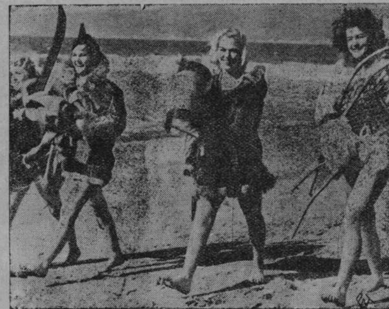
Na wybrzeżu kalifornijskim można w ciągu dwóch godzin przenieść się z upału letniego w krainę zimy. Po orzeźwiającej kąpieli morskiej młode dziewczęta śpieszą w góry aby użyć tam sportów zimowych.

Zw. Pracy Obywatelskiej Kobiet zorganizowa w Warszawie Dom Pracy Dobrowolnej, którym szeregi wykolejonych dziewcząt będą mogli otrzymać bezpłatne wyszkolenie fachowe. Na zdjęciu widzimy ogólny widok Domu Pracy Dobrowolnej obliczonego na 32 pensjonariuszek (u dołu widok szwalni)