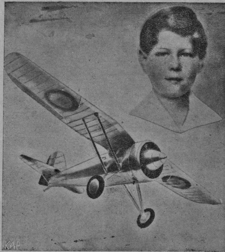
Gen. Rayski ofiarował ks. Michałowi następcy tronu rumuńskiego model samolotu polskiego, wykonany w \frac{1}{10} wielkości naturalnej.

Uroczystości w Rzymie z okazji Roku Świętego. Papież niesiony na tronie podczas procesji błogosławi tłumy.