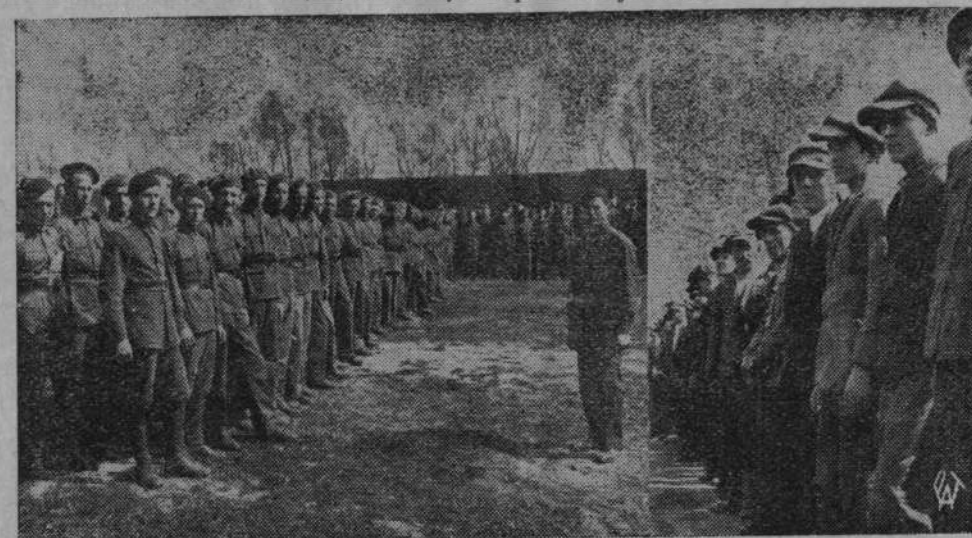
Na zdjęciu dwie drużyny „junaków” — ochotniczej młodzieży, która w obozach pracy znajdzie zatrudnienie, opiekę i naukę — przed i po umundurowaniu.