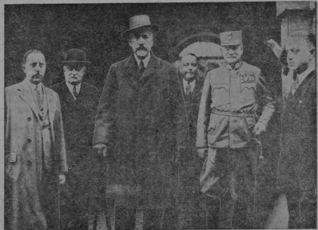
Arcyksiążę austriacki Eugenjusz (w środku) po przybyciu do Wiednia, zamieszkał w domu niemieckiego krzyża. Z lewej strony komendant miasta Schattl, z prawej minister obrony narodowej hrabia Schönburg-Hartenstein, który przywitał Habsburga na dworcu.