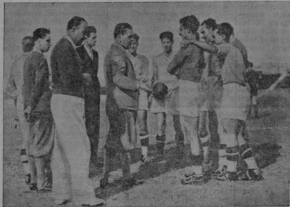
Amerykańska drużyna piłki nożnej w Bolonji przygotowuje się do rozgrywek o mistrzostwo świata.