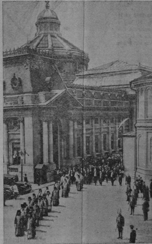
Procesja na ulicach Bukaresztu, gdzie w obecności rodziny królewskiej, rządu i korpusu dyplomatycznego, z wielką okazałością, odbyła się kanonizacja syna królewskiego Konstantyna Brancoveanu z okazji 220 rocznicy jego śmierci. — Brancovean czczony jest w Rumunji jako męczennik. Został on porwany przez Turków do Konstantynopolu i razem z jego synami ścięty w roku 1714.