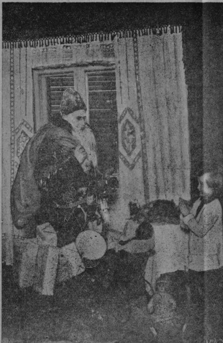
Święty Mikołaj niesie dary.