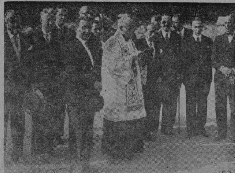
W Brukseli odbyło się poświęcenie terenu pod budowę pawilonu polskiego na Wystawę Międzynarodową. — Na zdjęciu — moment poświęcenia terenu.