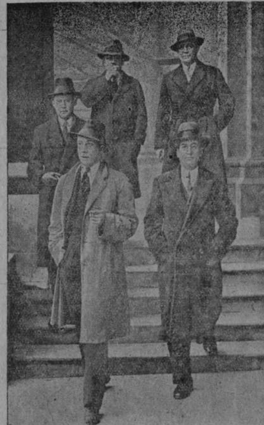
Prezydent komisji rządzącej w Zagłębiu Saary czyni starania celem zwiększenia sił policyjnych w Zagłębiu Saary. Kandydatów werbuje się w różnych krajach. Na obrazku widzimy młodych ludzi, którzy zgłosili się w Londynie do policji Saarskiej.