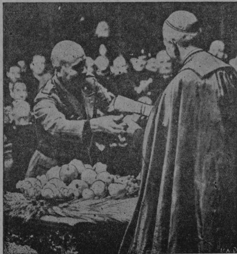
Mussolini wręcza jednemu z księży biskupów nagrodę za podniesienie wydajności rolniczej.