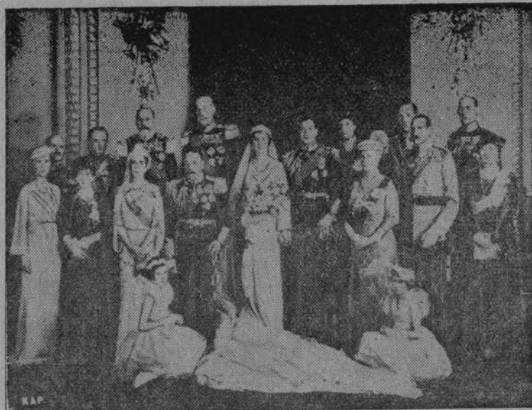
Na dworze angielskim odbył się ślub syna króla Jerzego V, ks. Kentu z ks. Maryną grecką.