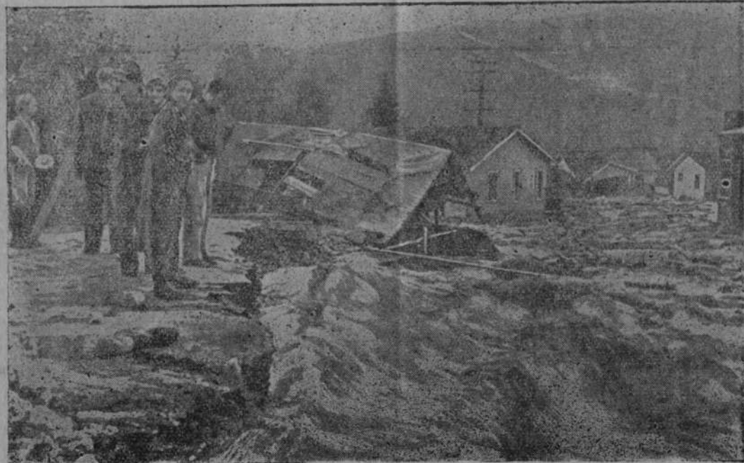
Kalifornię nawiedziła w bieżącym roku klęska niebywałej suszy. — Obecnie spadły znów takie ilości deszczu, że rzeki wystąpiły z brzegów i zaląły dalekie przestrzenie. — Wioska łontrose ucierpiała najwięcej, bo — jak widzimy na obrazku — woda porywała całe zabudowania. Szkody materialne obliczają na 2 miliony dolarów.