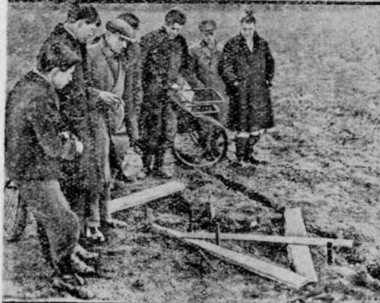
Jak już donosiliśmy swego czasu, że córki konsula amerykańskiego popełniły samobójstwo, skacząc ze samolotu z wysokości 5,500 metrów. Na zdjęciu naszym widzimy u góry: Badanie samolotu z którego się rzuciły pozostawiając list, oraz na dole: Miejsce, gdzie znaleziono zwłoki.