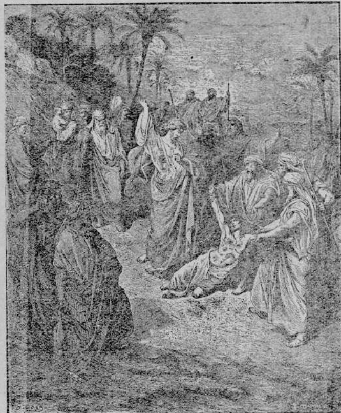
Pan Jezus wyrzuca czarta