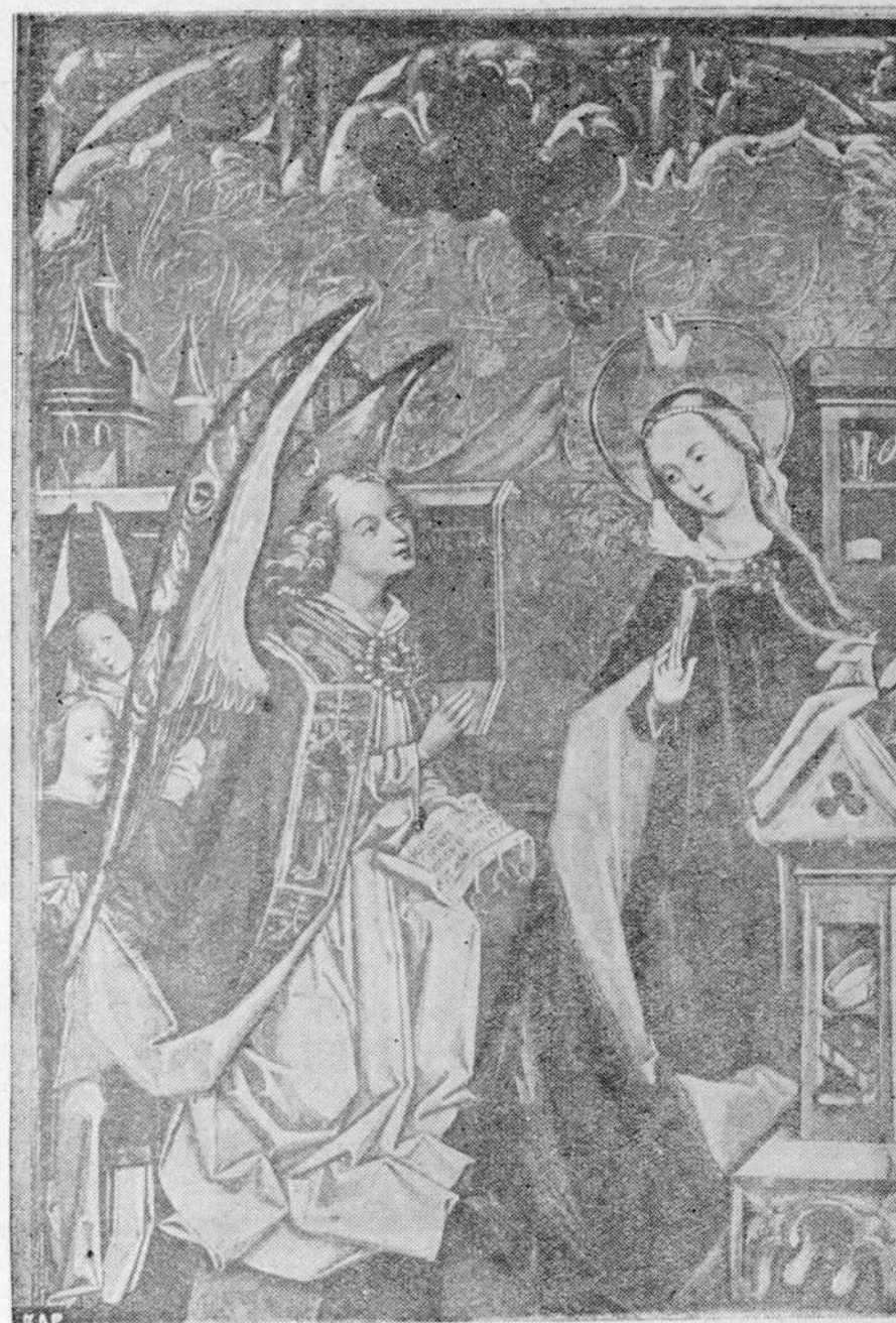
Zwiastowanie NMP. (Jeden z najpiękniejszych przykładów polskiego malarstwa z XV wieku. Obraz znajduje się w Olszku.)