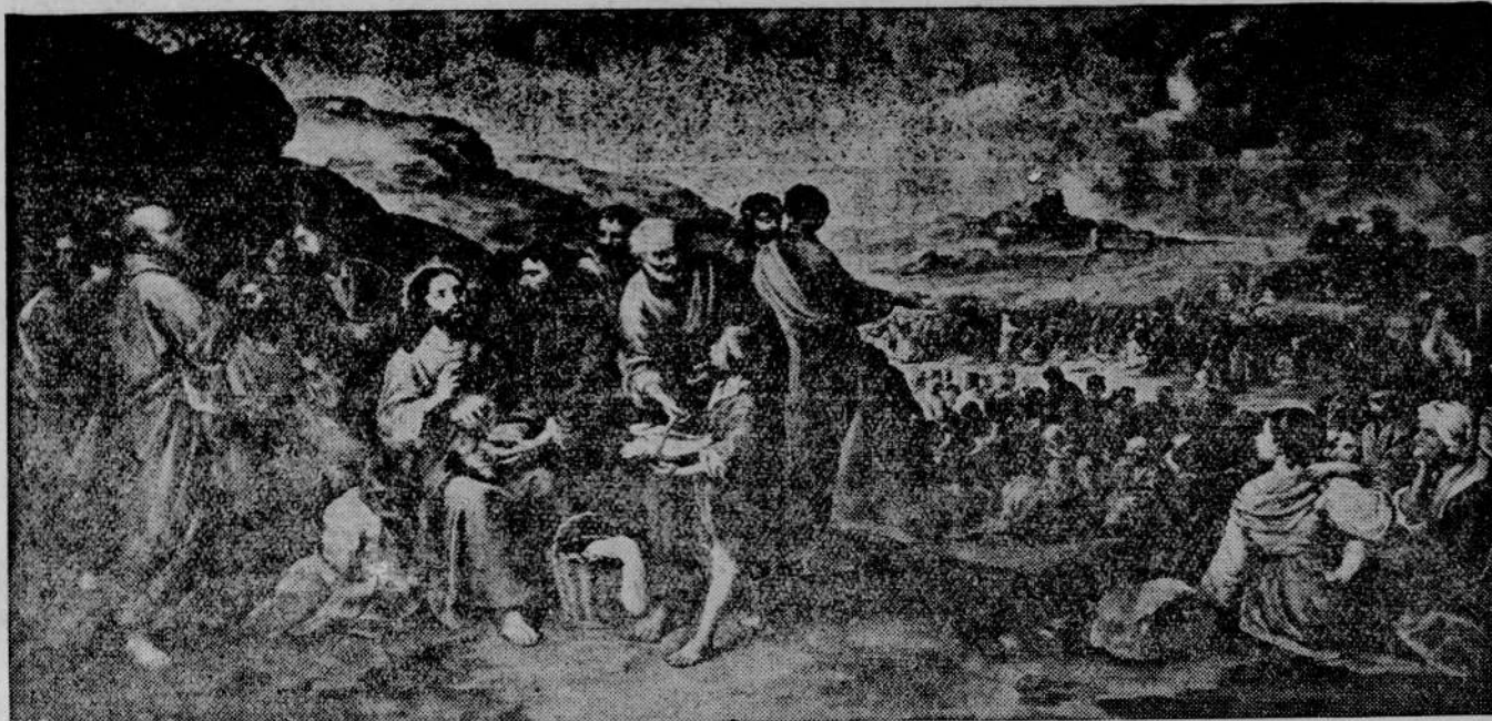
Cudowne rozmnożenie chleba p/g. obrazu Murillo, 1618-1682).