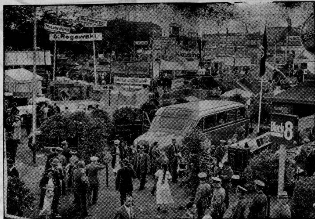
24. Targi Wschodnie otwarte zostały w Królewcu. Na obrazku widzimy fragment targów.