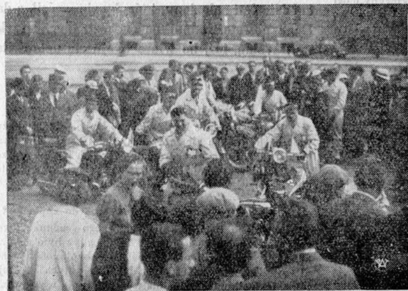
W piątek z placu Marszałka Piłsudskiego w Warszawie wyruszyło do Berlina na międzynarodowy zjazd gwiazdzisty 15-tu zawodników polskich, wyznaczonych przez Polski Związek Motocyklowy.