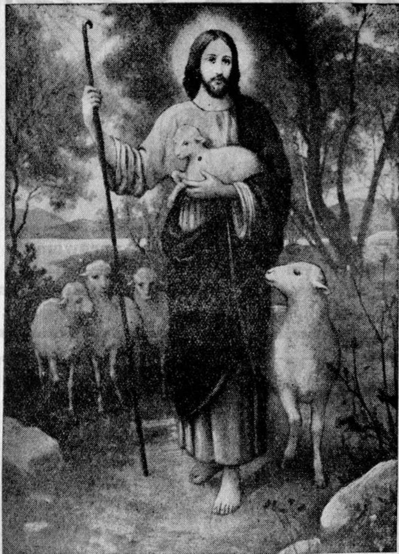
Jam jest dobry Pasterz.