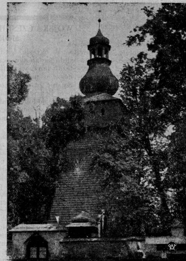
Widok starożytnego kościółka.