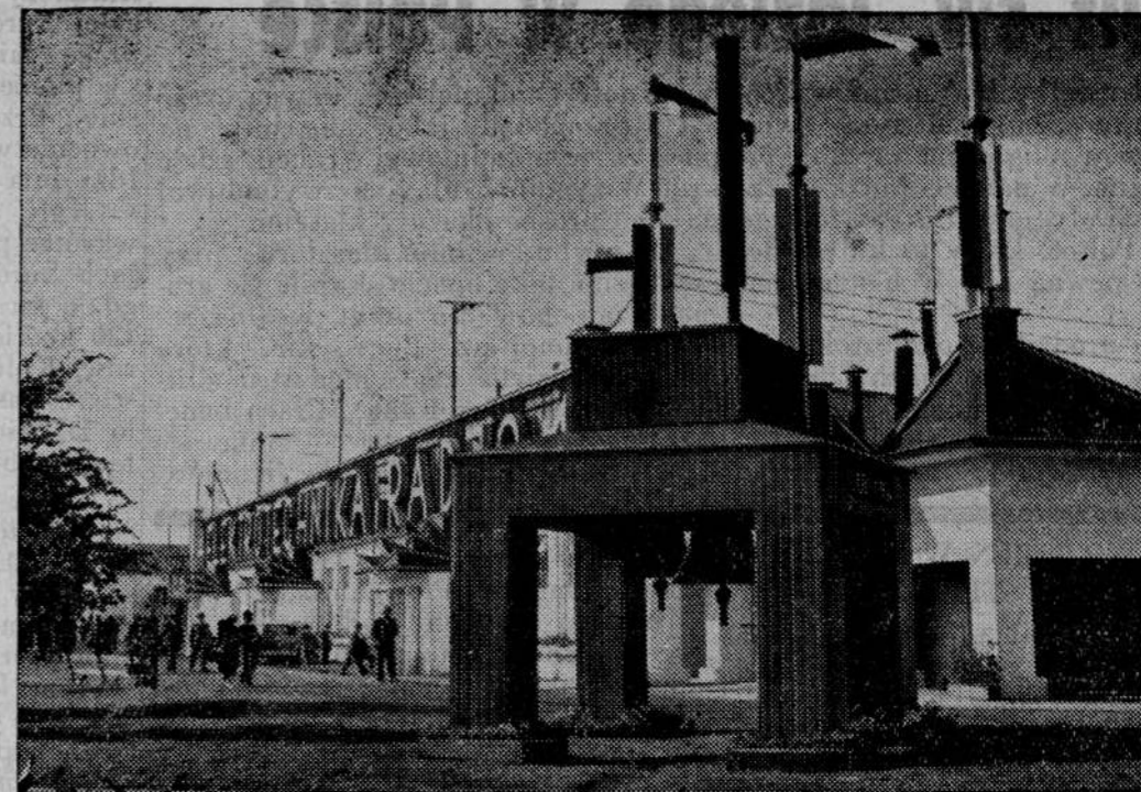
Z wystawy przemysłu metalowego i elektrycznego. Wejście do pawilonu radjowego.