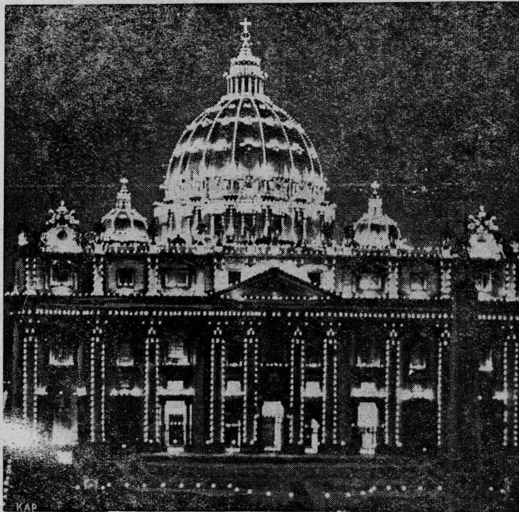
Bazylika św. Piotra w Rzymie iluminowana podczas obchodu rocznicy koronacji Papieża Piusa XI

pokojowego zapotrzebowania w surowcach i środkach żywności musi Japonia sprowadzać z zagranicy. Płk. Buelow podkreśla, że tak ważny surowiec dla lotnictwa i floty jak olej, Japonia jest w stanie wyprodukować u siebie tylko w 25 proc. na Sachalinie, resztę musi sprowadzać z Indyj Holenderskich oraz Stanów Zjednoczonych Ameryki Północnej.