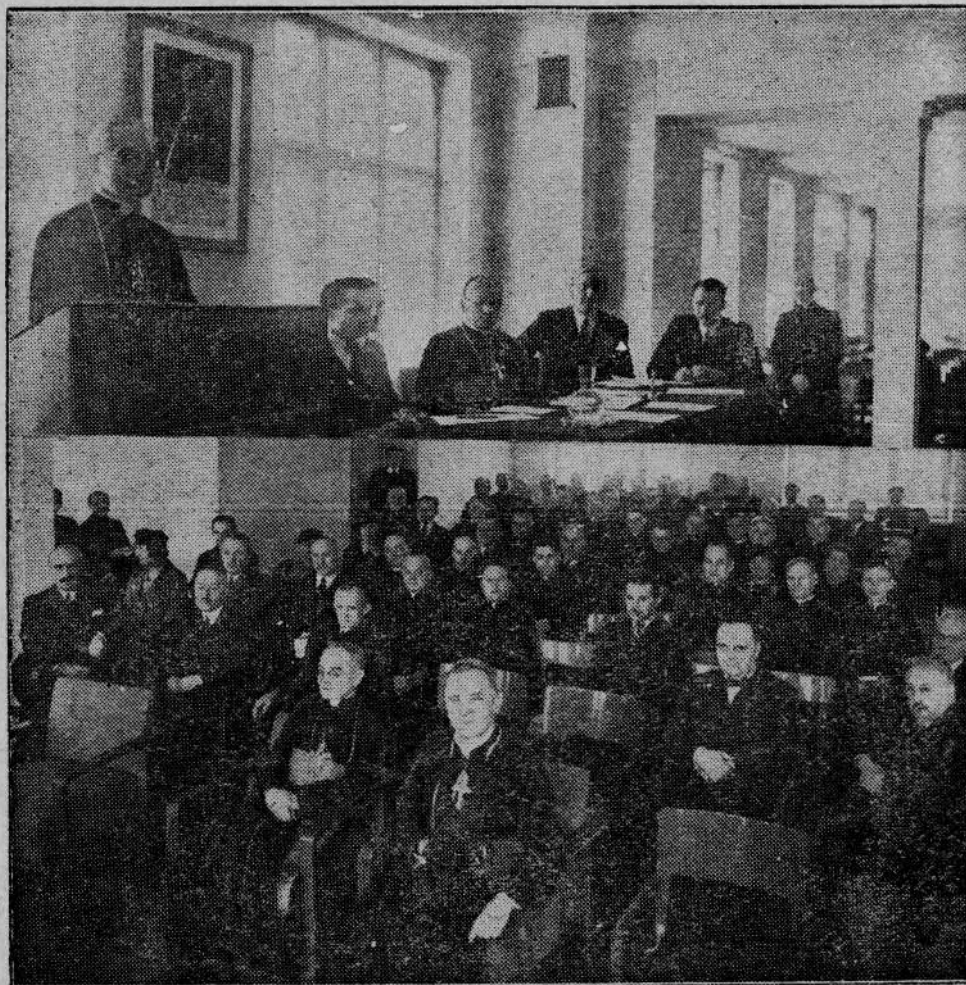
W Warszawie odbył się w dniach 24 i 25 lutego br. pod przewodnictwem JE. Ks. Biskupa Adamskiego zjazd redaktorów polskiej prasy katolickiej. Prezydium Zjazdu. Część sali obrad.

Oprócz księżniczek także i wszystkie inne dziewczynki krainy wschodzącego słońca otrzymują w tym dniu lalki. Na wystawach magazynów z zabawkami widnieją już w końcu lutego obok zupełnie tanich lalek, także i wspaniałe „cacka”, z których każde kosztuje poważną sumę. W dniu „święta lalek”, cały naród japoński zapomina o wszelkich troskach i cieszy się radością swoich obdarowanych dzieci.