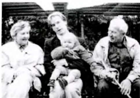
P1290125.JPG ~1.0 MB