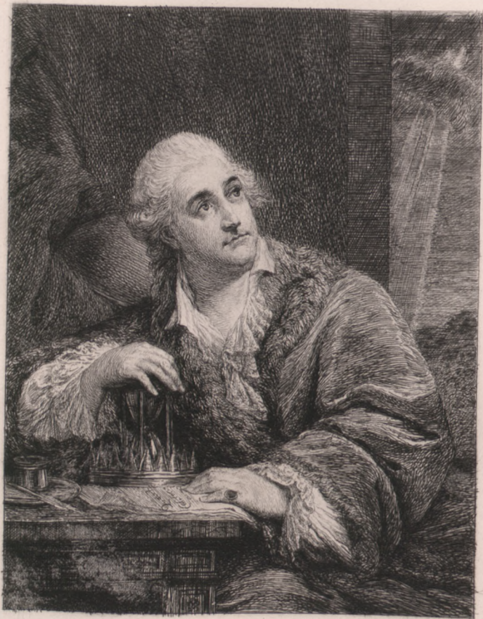
STANISLAS-AUGUSTE PONIATOWSKI, (ROI DE POLOGNE)