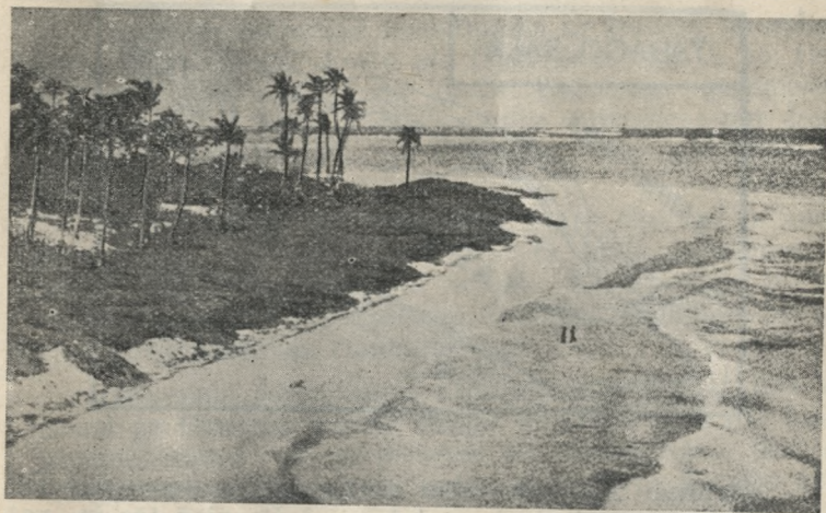
Tabago salas skats.

kuņu briesmīgās, tanīs apgabalos parastās aukas nekad nepiemeklē. Viņa ir tīra no sagiftētiem tvaikiem, kuņus karstā siltzemes saule mēdz purvajos izvārīt, jo Tabago salai ir daudz un augsti kalni, no kuņiem ceļas 128 upes un neskaitāms pulks avotu, kuņu virsotnes tērtas tumšiem ciedru un citiem dienvidus koku mežiem. Paši no sevis un bez cilvēku kopšanas turienes zemē aug pipari, kakao, indīgo, cukura niedres un smirdošais un taču tā iemīļotais stāds, kuņu parasti dēvē par tabaku, bet citādi arī par svēto vai ķēniņa stādu saukā, tādēļ ka tas no tā