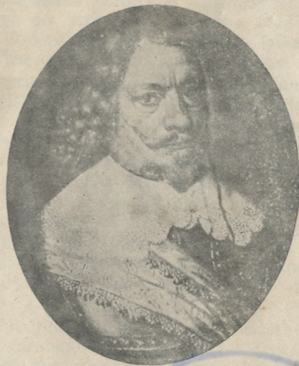
Kurzemes hercogs Jēkabs.