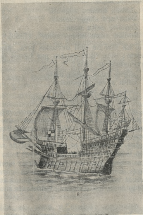
XVII g. s. kuģis.

Aiz zināmiem iekšpolitiskiem apstākļiem, kuŗi iespaidoja un noteica hercoga ārējo politiku, šis Kurzemes un tam līdz viņas kuģniecības uzplaukuma periods beidzās līdz ar hercoga Jēkaba nāvi, jo, par nožēlošanu, „lielam“ tēvam seko „mazs“ dēls.