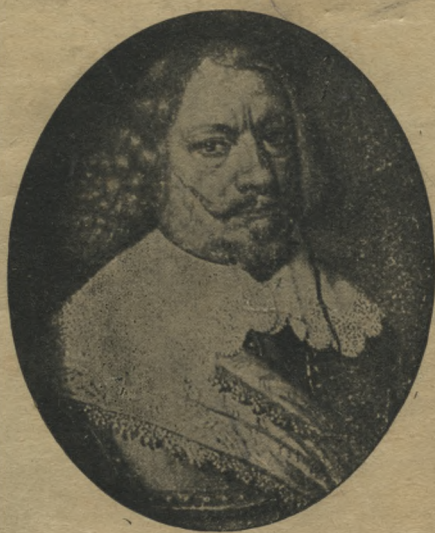
Kurzemes hercogs Jēkabs.