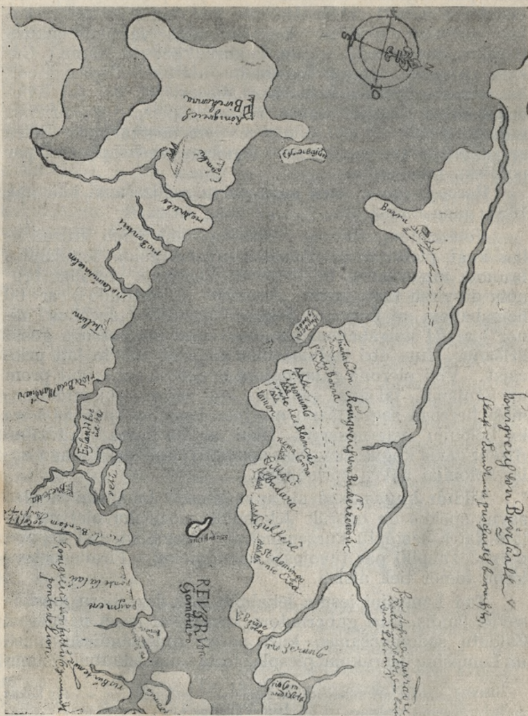
Gambijas karte pēc Kurzemes jūrnieku uzņēmuma (ap 1656. g.)